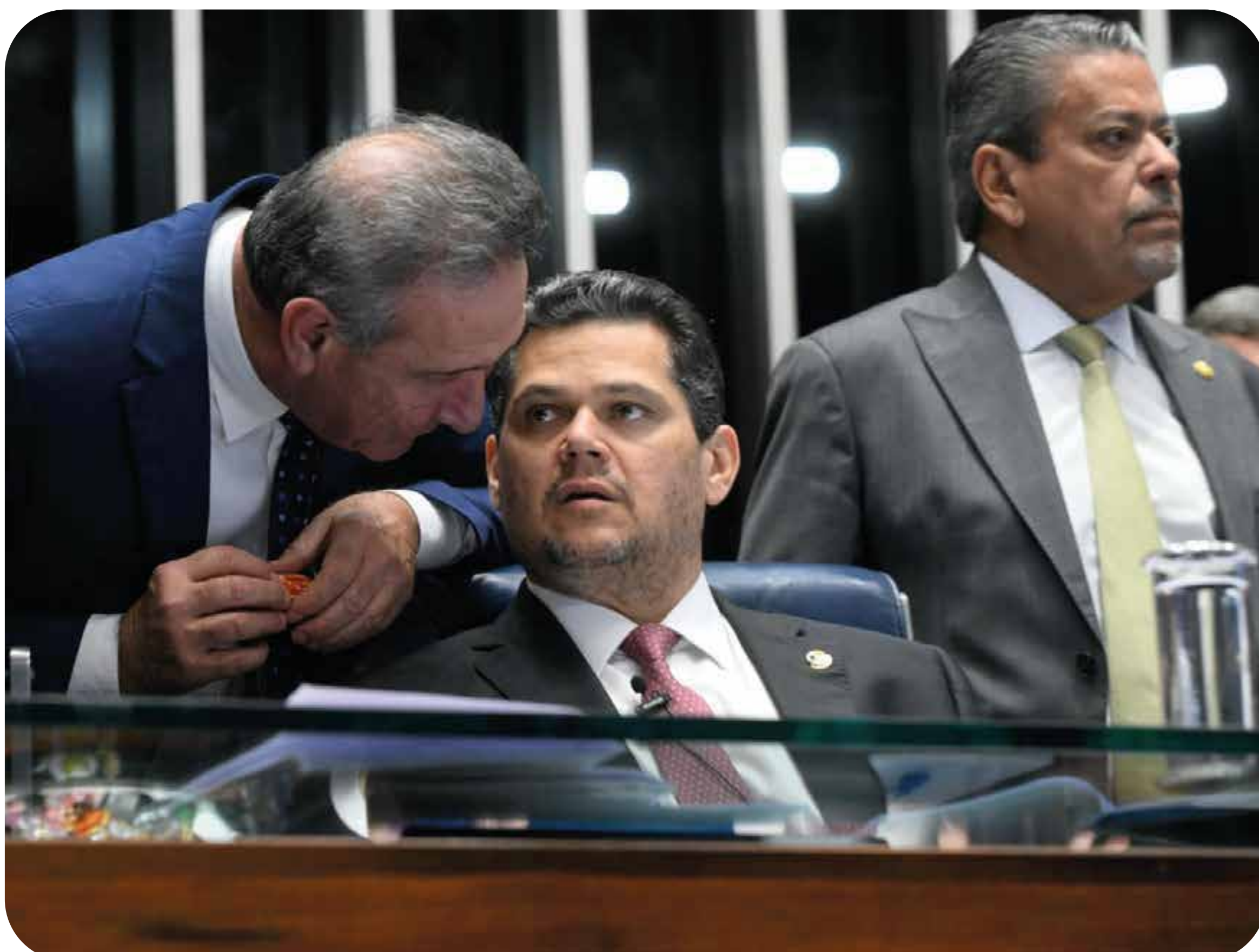
Presidente do Senado, Davi Alcolumbre

O Senado aprovou, no dia 10 de junho, o Projeto de Lei (PL) 5.122/23, que cria uma linha especial de crédito para o refinanciamento do agronegócio. A proposta, chamada de “Refis do Agro”, foi colocada em votação pelo presidente da Casa, Davi Alcolumbre (União-AP), mesmo após reunião com o governo para debater a medida, que autoriza o uso de recursos do Fundo Social do Pré-Sal para a renegociação de dívidas de produtores rurais.