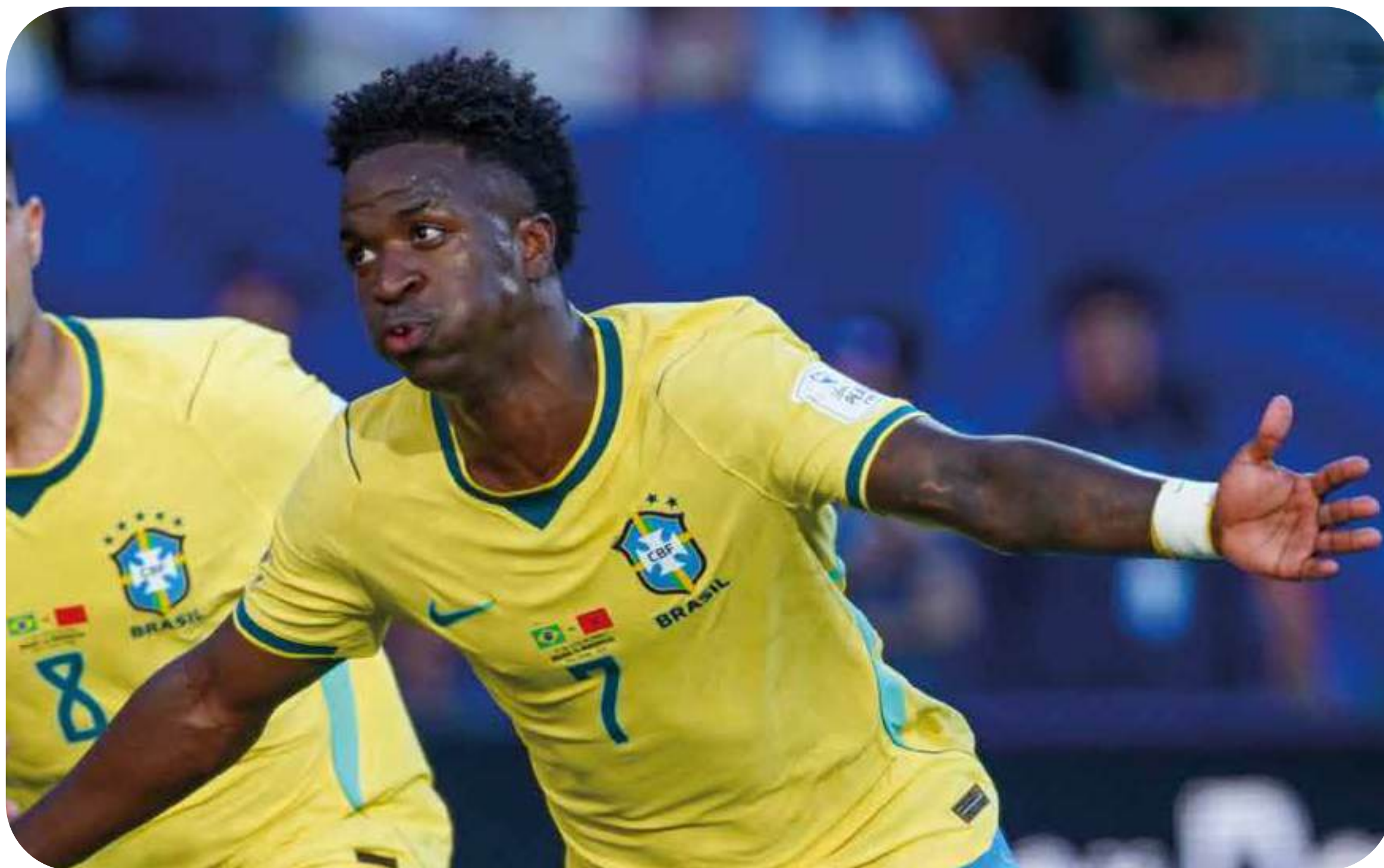
Vini Jr. na estreia do Brasil na Copa do Mundo.

JOÃO PEDRO ANDREASSY CASTRO, DE SÃO PAULO (SP)