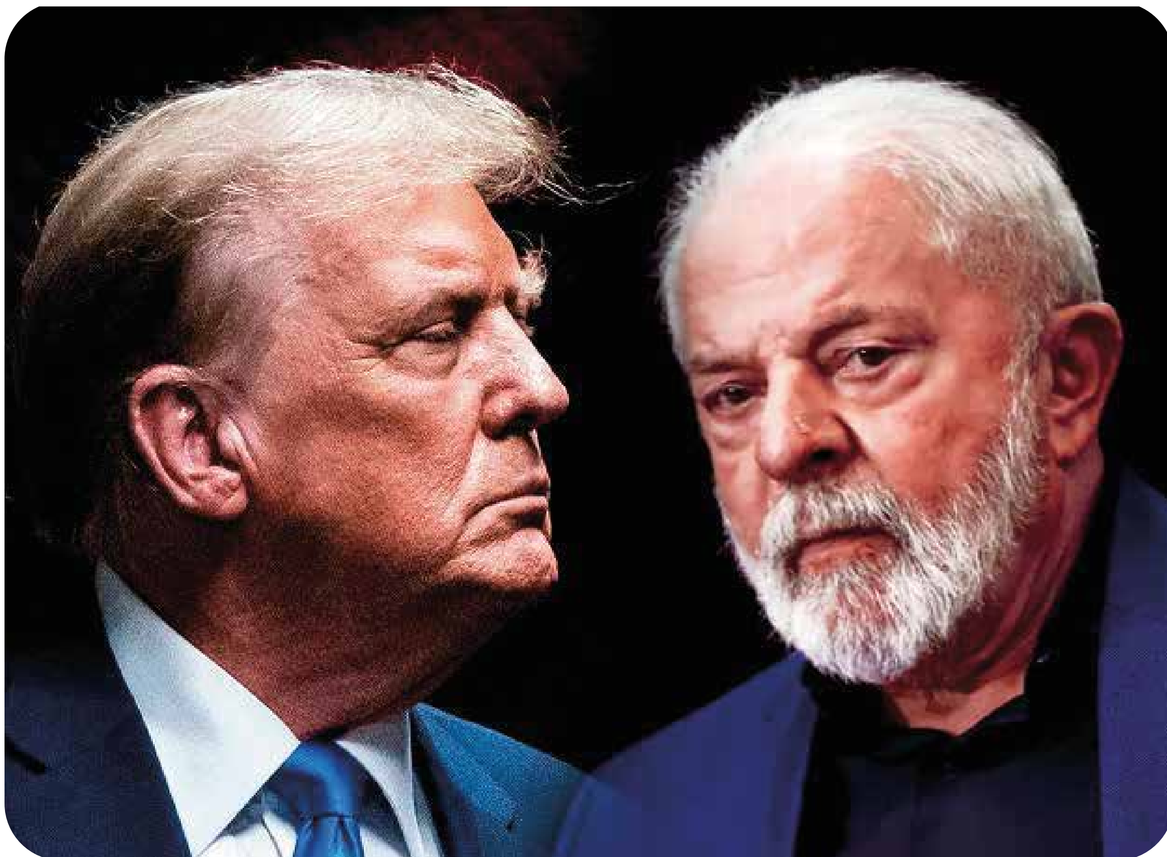
Donald Trump e Lula

A extrema direita bolsonarista é um cachorrinho de Trump. São traidores da pátria. Articularam os ataques que prejudicam todo o país. São defensores e promotores abertos da subserviência do Brasil aos EUA. Para eles, se Trump atacar com bombas as favelas no Rio, melhor. Se o Brasil virasse um estado dos Estados Unidos, comemorariam.