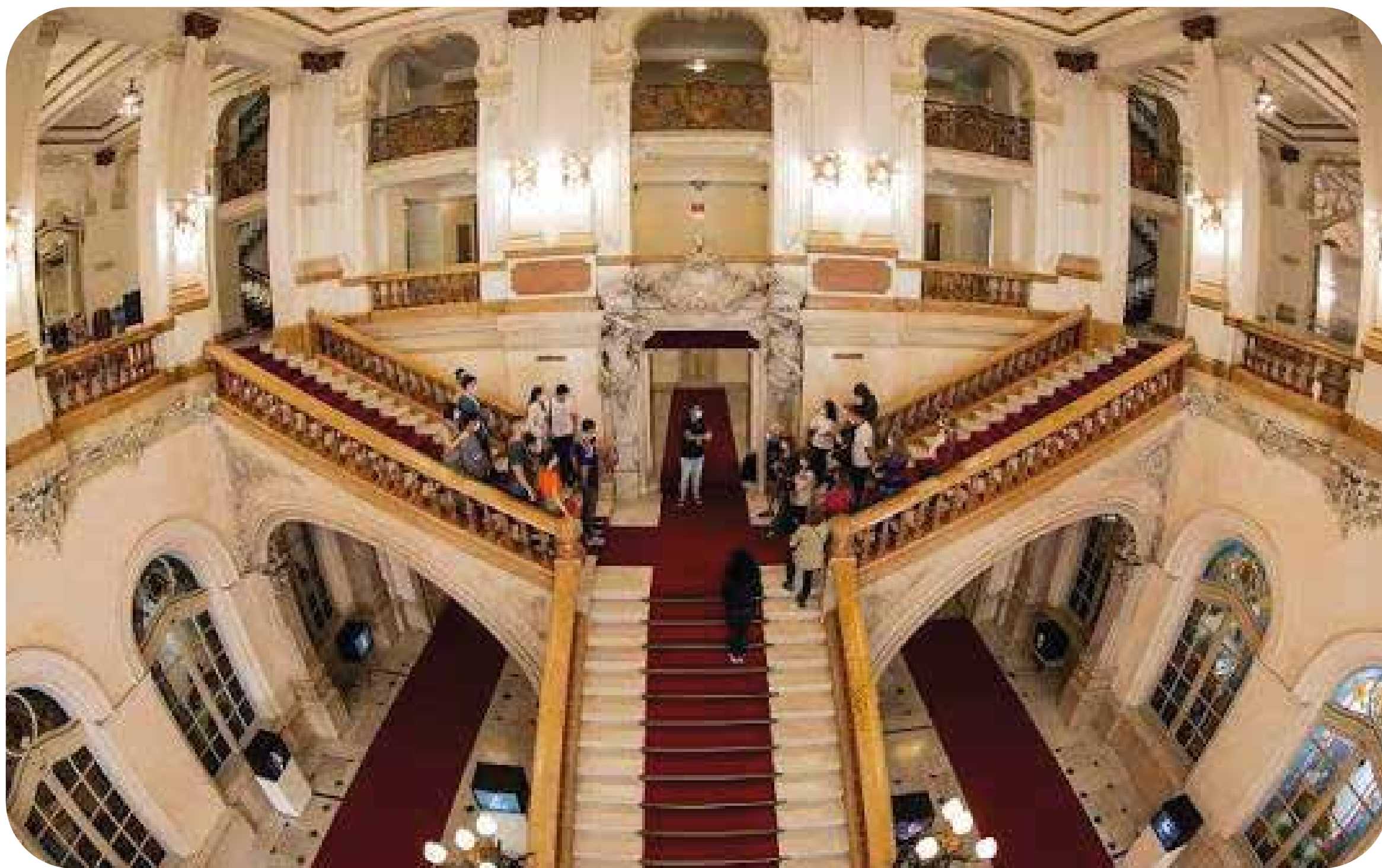
Theatro Municipal de São Paulo

A nova organização social contratada pela prefeitura de São Paulo, do bolsonarista Ricardo Nunes (MDB-SP), para assumir a gestão do Theatro Municipal iniciou suas atividades com um compromisso: tirar negros, indígenas e LGBTIs do palco e colocá-los na plateia.