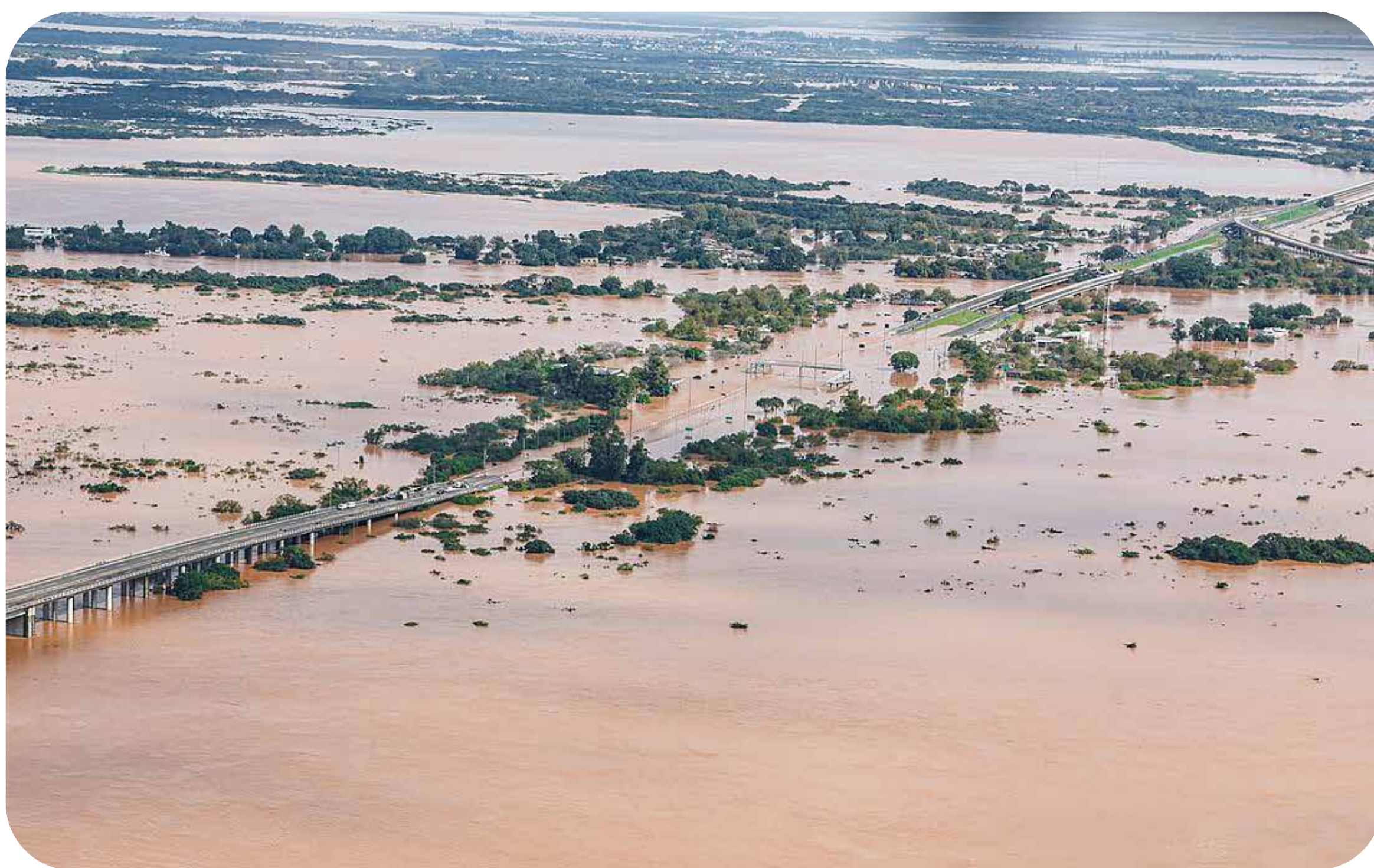
Enchente de 2024 no Rio Grande do Sul.

ALICE SEBEN CAMPANA, DA SERRA GAÚCHA (RS)