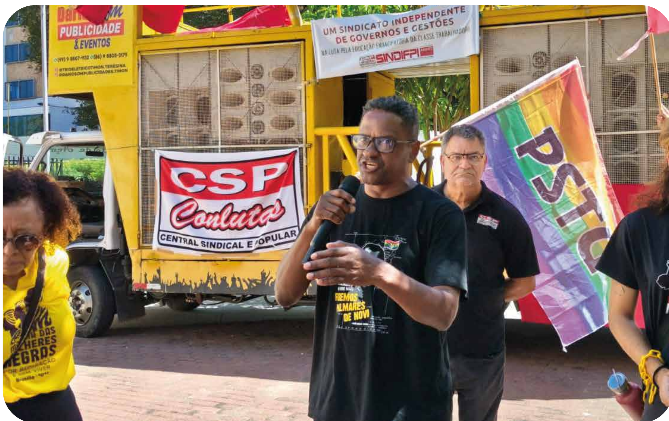
Campanha pré-eleitoral em Teresina.