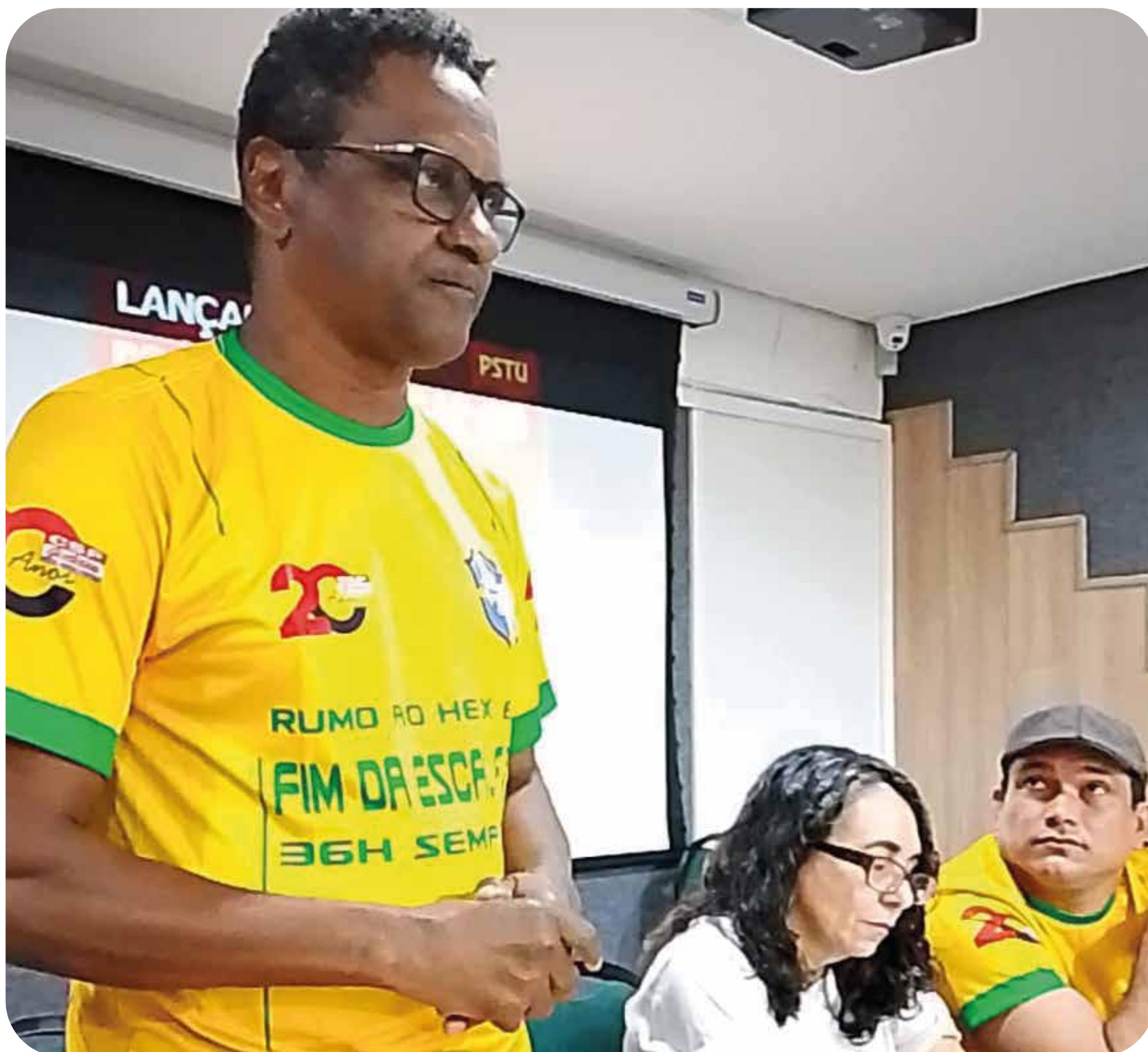
Campanha pré-eleitoral em Fortaleza.