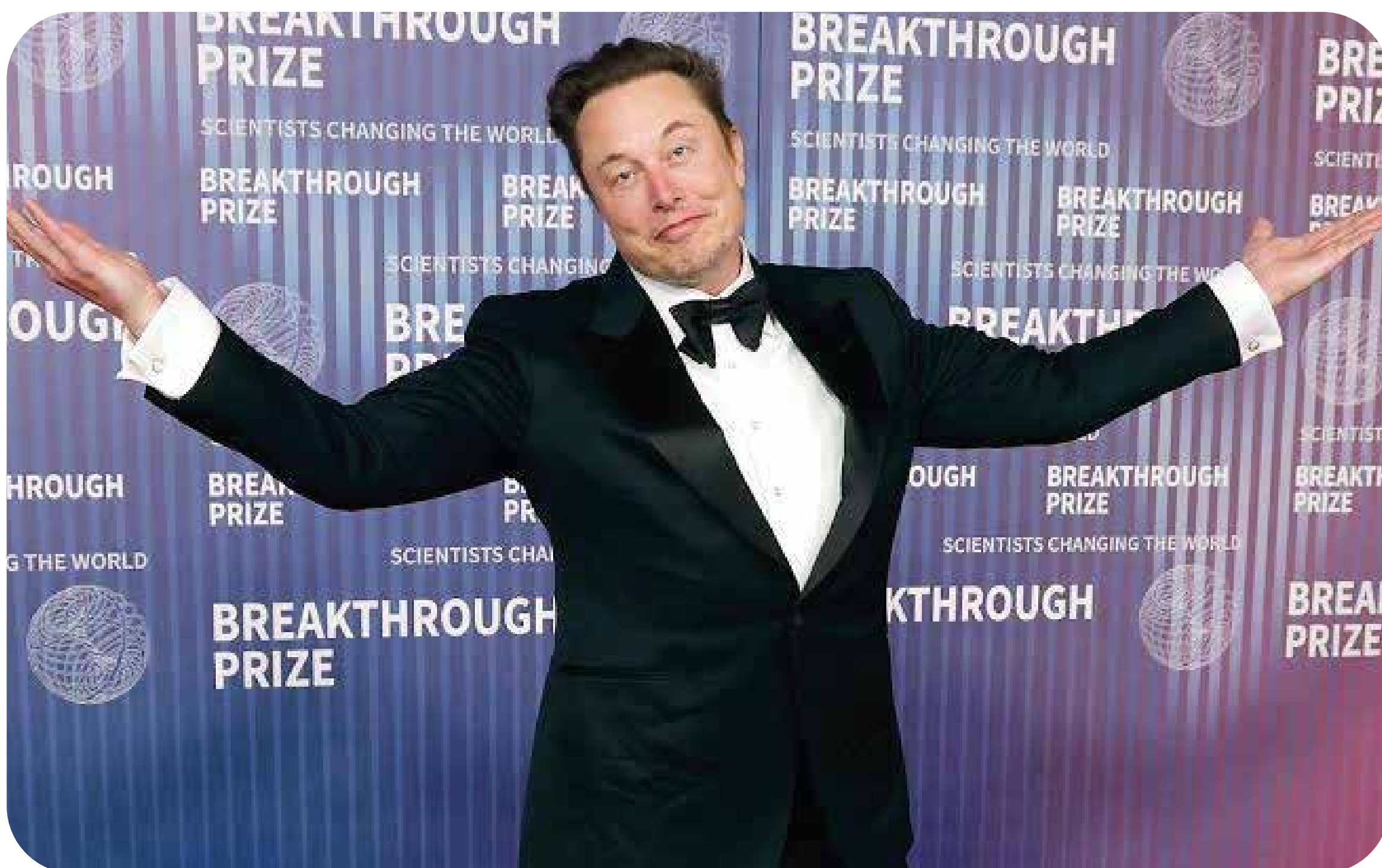
Elon Musk.

A fortuna atual de Elon Musk é avaliada em US$ 1,1 trilhão. Para efeito de comparação, se uma pessoa recebesse US$ 1 milhão por mês, levaria cerca de 83 mil anos para acumular uma riqueza equivalente à de Musk. Essa fortuna corresponde à riqueza de quase metade da população mais pobre do planeta e escancara o caráter desigual e perverso do capitalismo.■