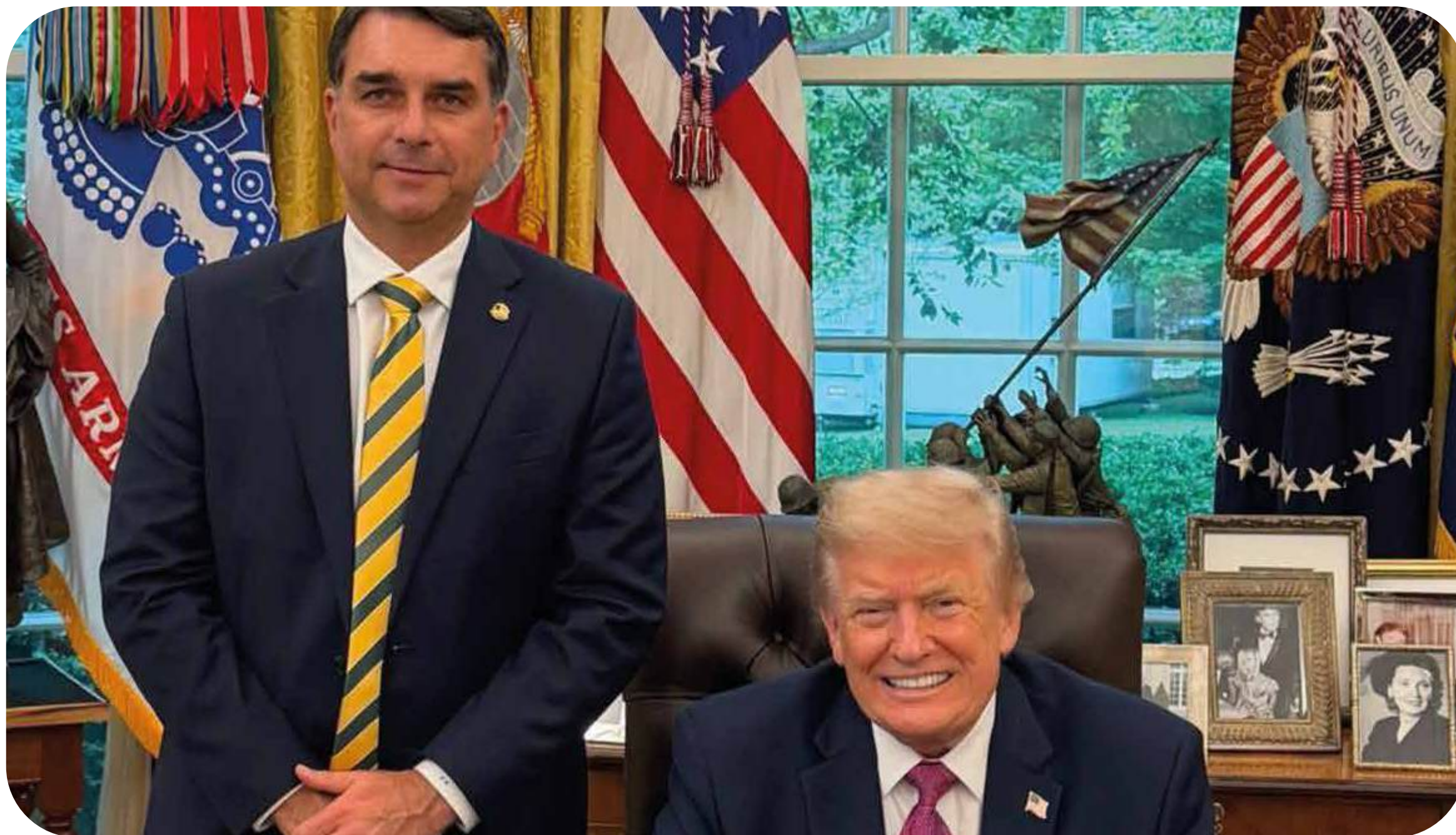
Flávio Bolsonaro em visita a Donald Trump.

governo Lula não enfrenta o imperialismo. Ao contrário, tem como política entregar o país a quem pagar melhor. Ambos vestem camisas de cores diferentes, mas jogam contra o Brasil.