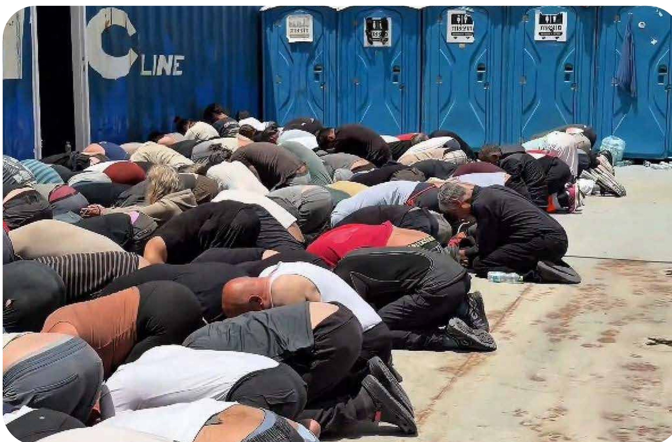
Imagens divulgadas pelo ministro israelense da Segurança Nacional, Itamar Ben-Gvir, mostram ativistas sequestrados com as mãos amarradas e obrigados a ficarem de joelhos em navio militar

Está nas mãos da solidariedade internacional a tarefa de ecoar as vozes palestinas e acelerar o declínio do projeto colonial sionista. A resistência palestina ensina o caminho.■