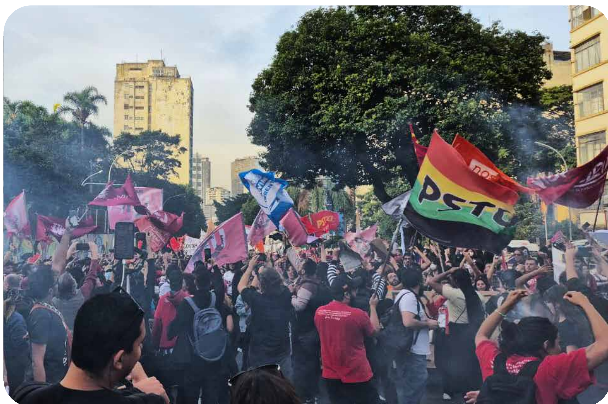
Ato unificado estaduais paulistas.

Por isso, defendemos que é preciso dar um passo unindo a luta em defesa da permanência à greve dos servidores, com o movimento estudantil entrando em cena nacionalmente.