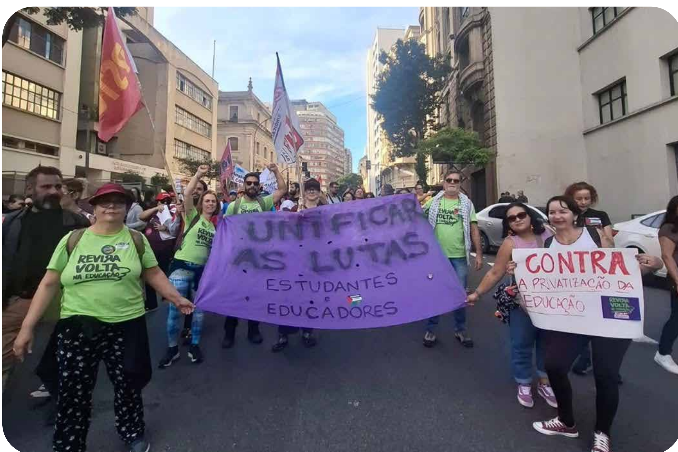
Ato unificado dos profissionais da educação e estudantes.

A greve dos profissionais de educação do município de São Paulo teve início no dia 28 de abril com uma assembleia em frente ao gabinete do prefeito Ricardo Nunes (MDB). Com um sol escaldante de outono, centenas de professoras e professores votaram com entusiasmo o início da greve.