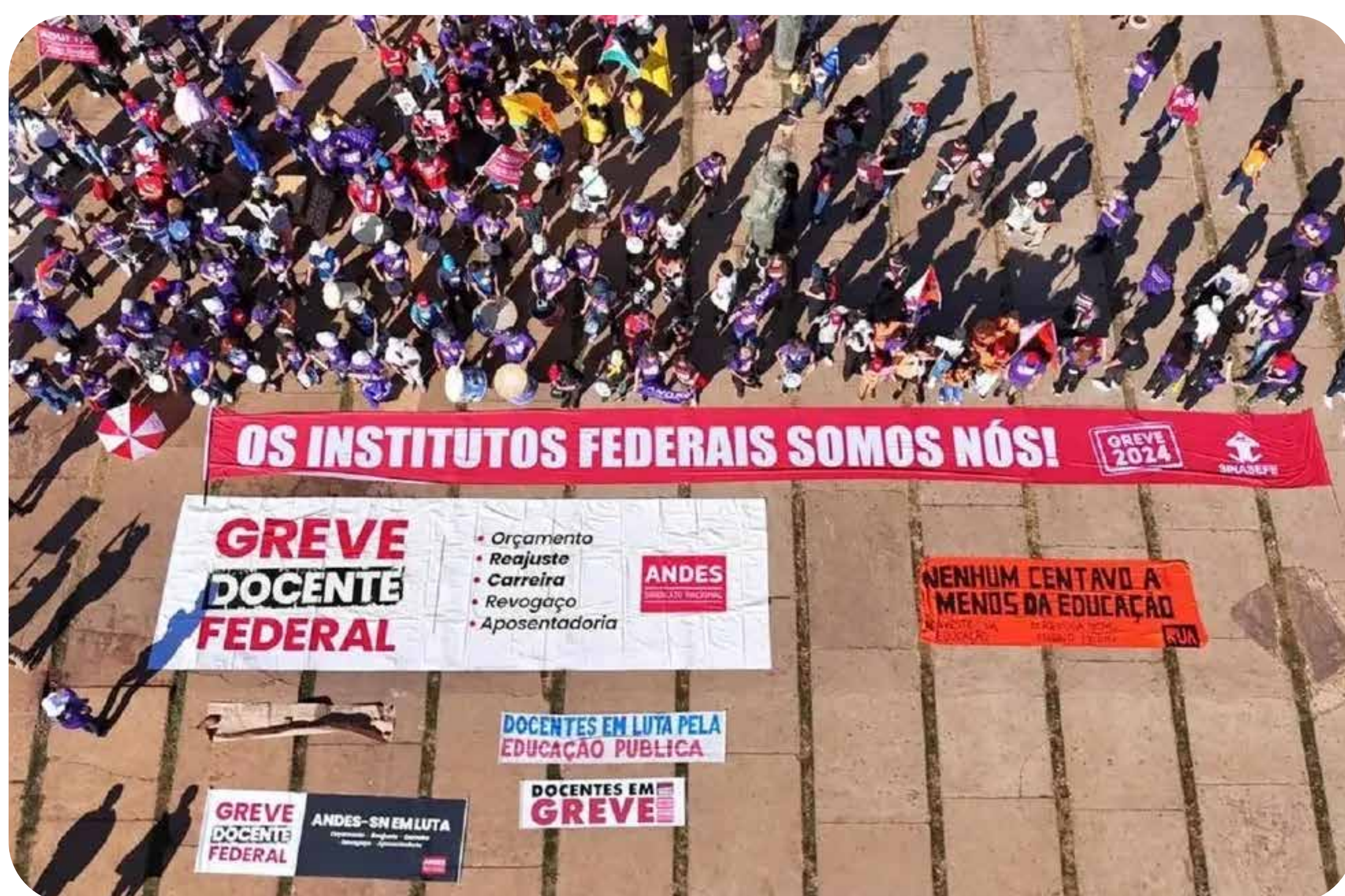
Greve Fasubra.

ALEXANDRO C. FLORENTINO, DE NITERÓI (RJ)