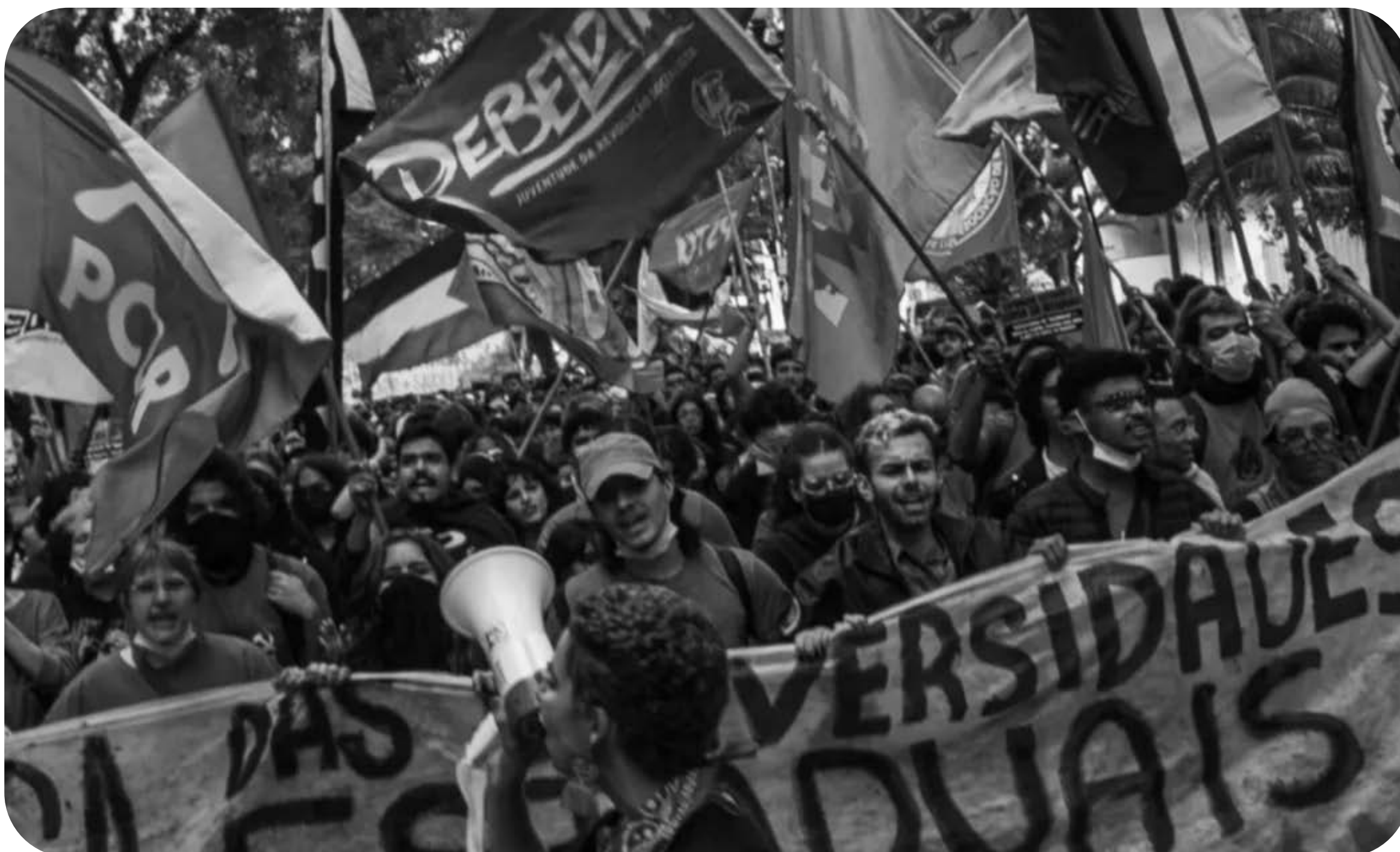
Manifestação das estaduais paulistas em greve.

A greve da USP completou um mês e está em um momento decisivo. Após a segunda mesa de negociação, a reitoria encerrou de forma arbitrária as tratativas. Ocupamos a reitoria, exigindo a reabertura do diálogo. Após a desocupação violenta pela PM, o apoio à greve só cresceu. Foram realizados atos massivos, em conjunto com as outras estaduais, com mais de 5 mil estudantes, e a USP se unificou com os professores municipais, tomando a Avenida Paulista e mostrando a força e a legitimidade da nossa luta.