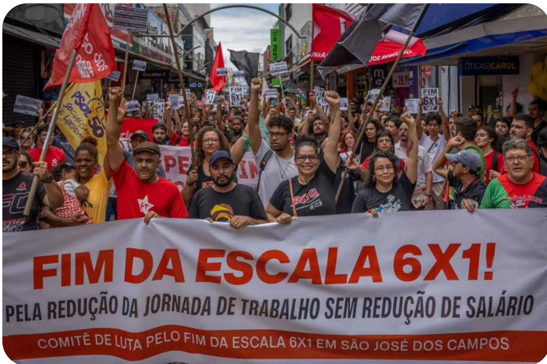
Ato pelo Fim da Escala 6x1.

É hora de irmos às ruas para retomar nosso tempo de vida roubado!