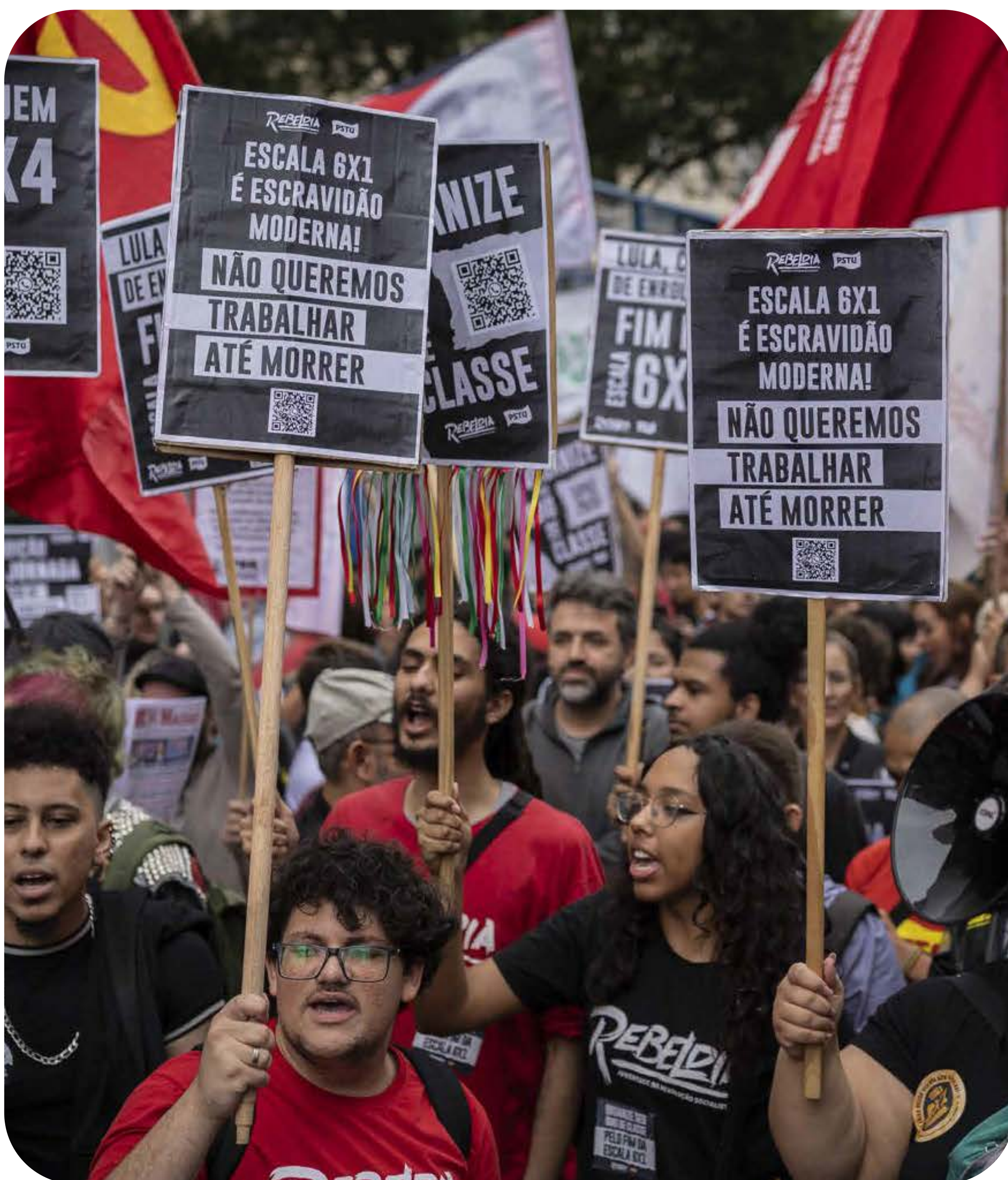
Ato na Avenida Paulista pelo fim da escala 6x1

A redução da jornada de trabalho é uma dívida histórica com a classe trabalhadora deste país. E quem acumulou bilhões à custa das jornadas exaustivas e das escalas abusivas é que deve pagar essa conta.■