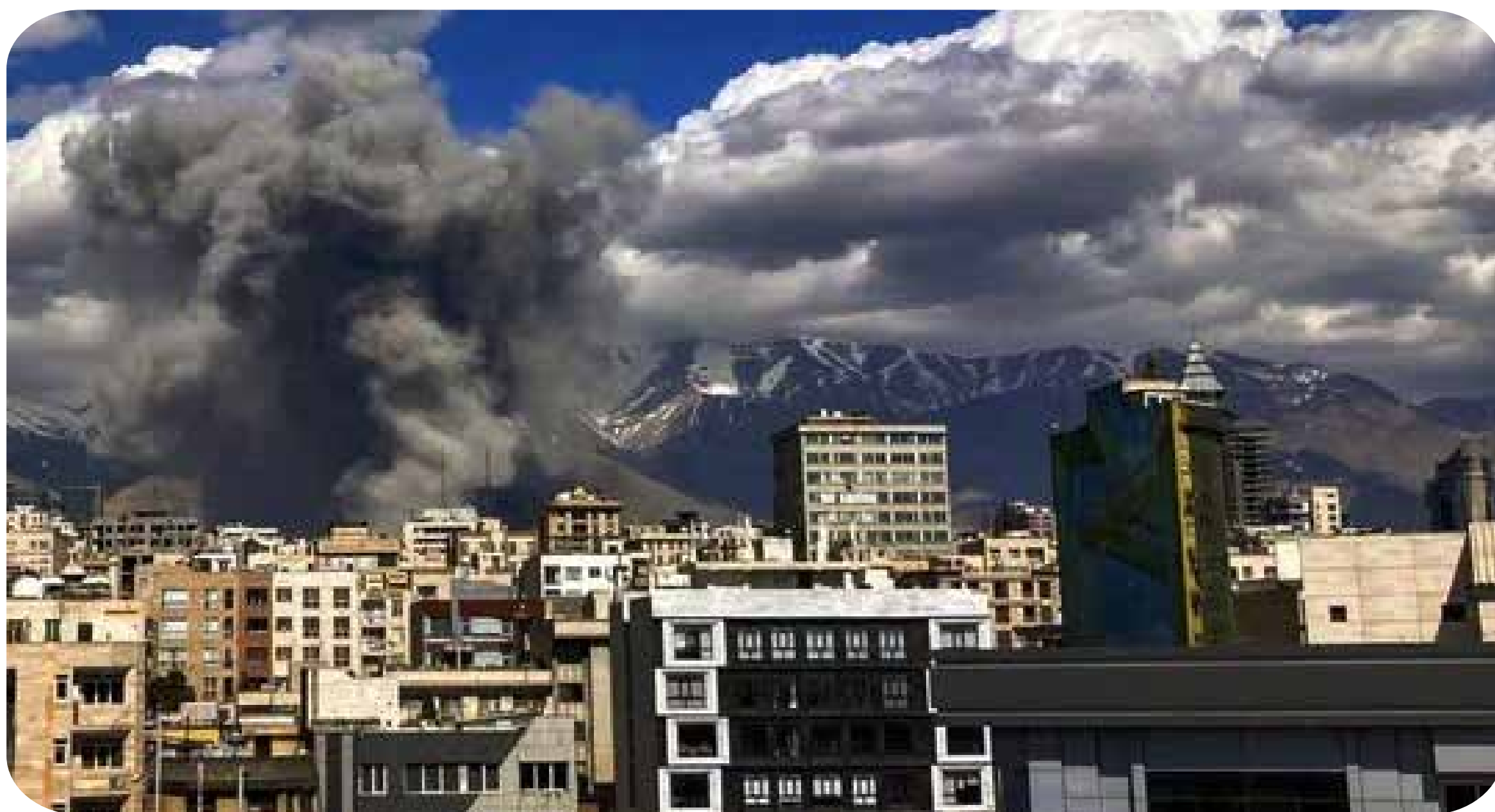
Ataques dos EUA e de Israel contra o Irã.

Para o PSTU, segue colocada a luta pela derrota militar e política do imperialismo estadunidense e de Israel no Irã, no Líbano e na Palestina. A derrota abrirá o caminho para as lutas dos povos oprimidos contra os imperialismos em todo o mundo, e por isso é de interesse da classe trabalhadora mundial. Isso não implica nenhum apoio político ao regime iraniano, que enfraquece a defesa do país contra o imperialismo ao reprimir a classe trabalhadora iraniana com massacres como os efetuados nos dias 8 e 9 de janeiro e prisões e execuções de manifestantes que lutam por liberdades democráticas e melhores condições de vida.