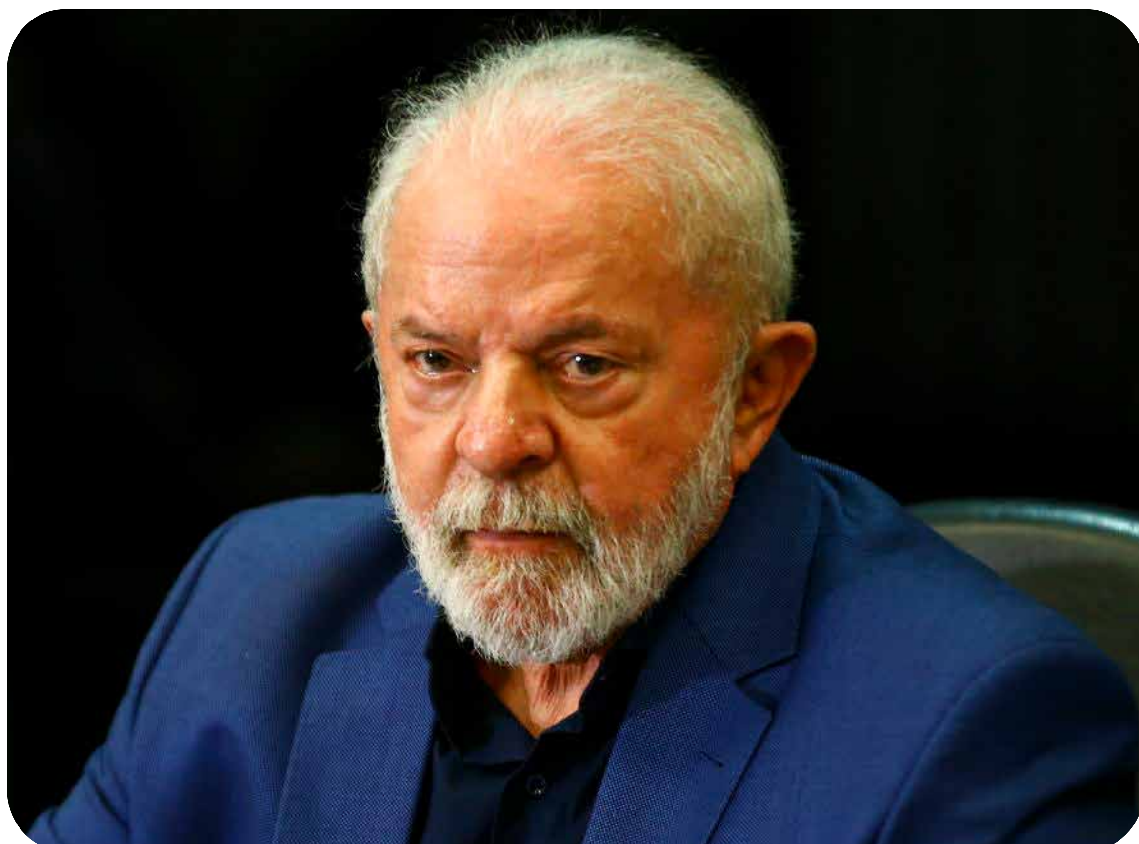
Presidente Lula.

Os trabalhadores precisam se manter independentes, fortalecendo uma oposição de esquerda com programa revolucionário e socialista. Esse é o caminho para derrotar a extrema direita de verdade.■