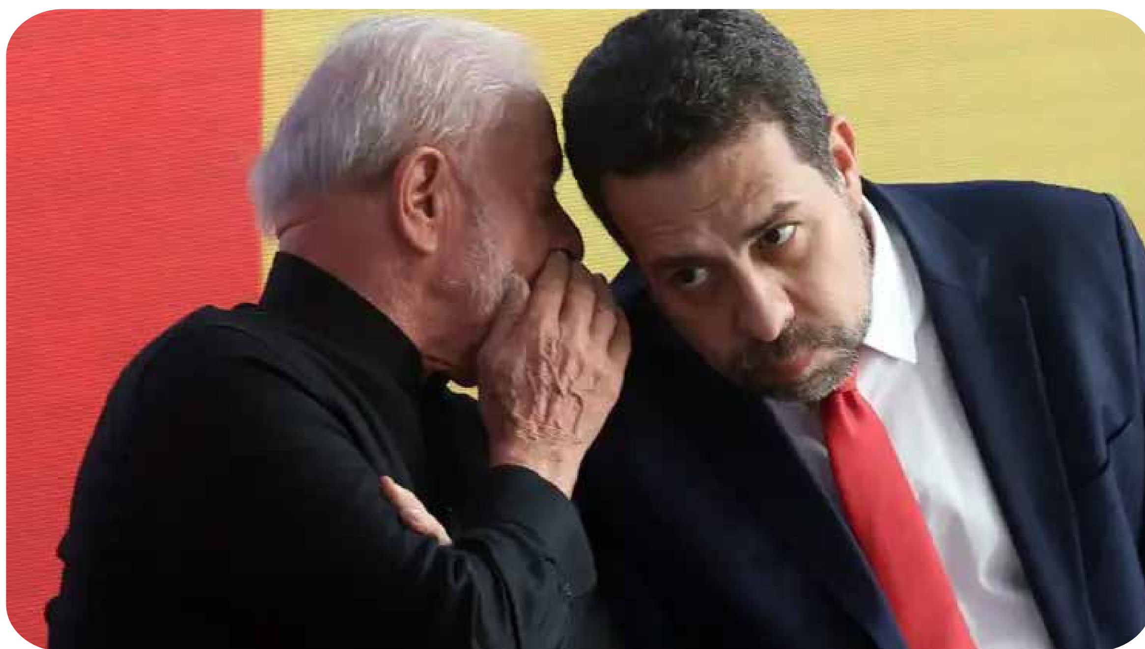
Presidente Lula e ministro-chefe da Secretaria-Geral da Presidência da República Guilherme Boulos

No momento em que avançam as articulações para as próximas eleições, os setores majoritários da esquerda capitalista já anunciaram o apoio à reeleição de Lula logo no primeiro turno. O caso do PSOL é emblemático: apesar de fracassada a tentativa de compor uma federação com o PT, o partido, que já compõe o governo, omitiu-se de apresentar uma alternativa própria e definiu o voto a Lula desde já.