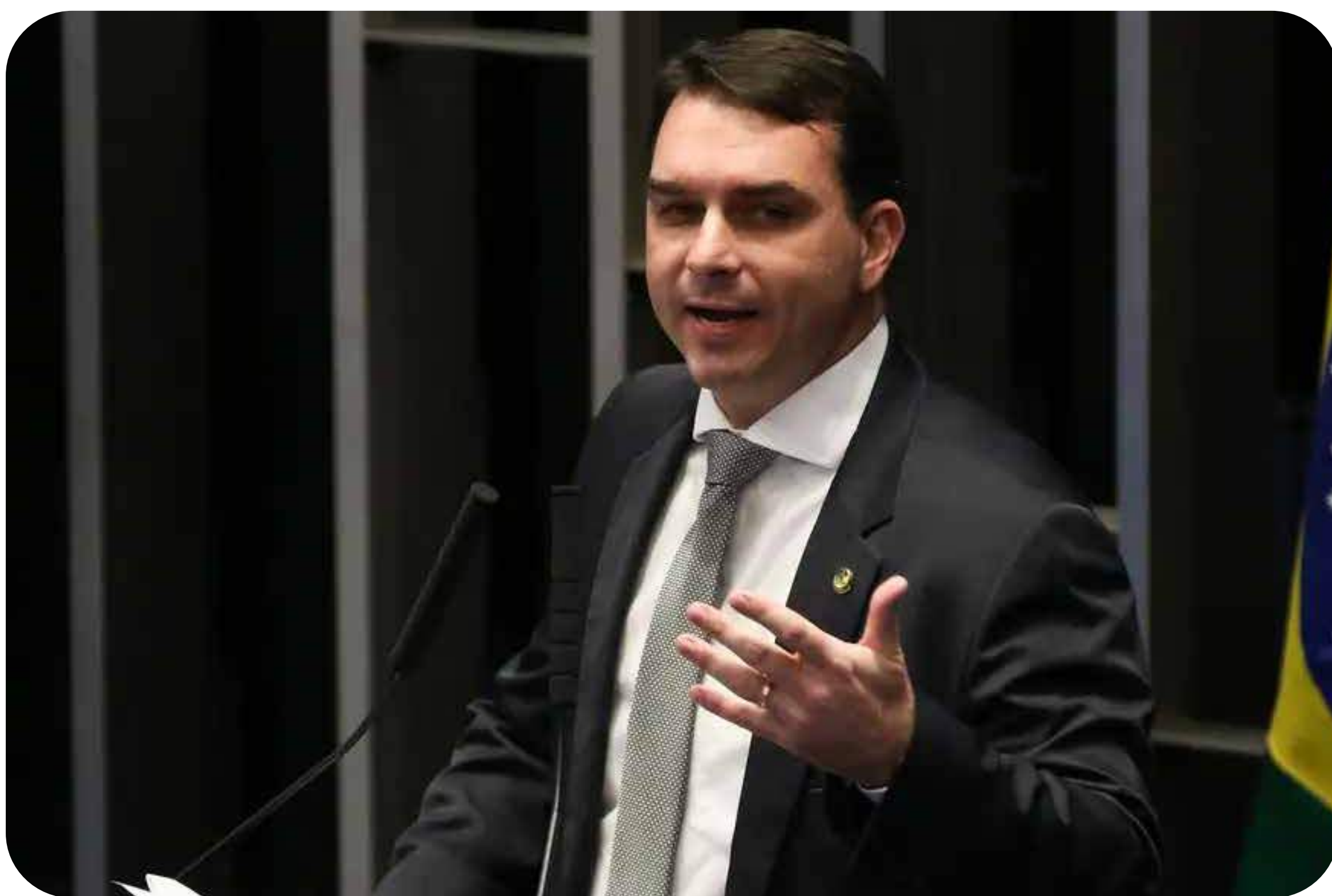
Flávio Bolsonaro.

riquezas nacionais, a submissão política aos Estados Unidos e a destruição de qualquer direito dos trabalhadores. Combina-se a isso o autoritarismo, a violência contra mulheres, negros e LGBTI+ e o obscurantismo. Enfrentar e derrotar o bolsonarismo é uma tarefa fundamental para os trabalhadores. Para isso é preciso romper o sistema capitalista que o alimenta.