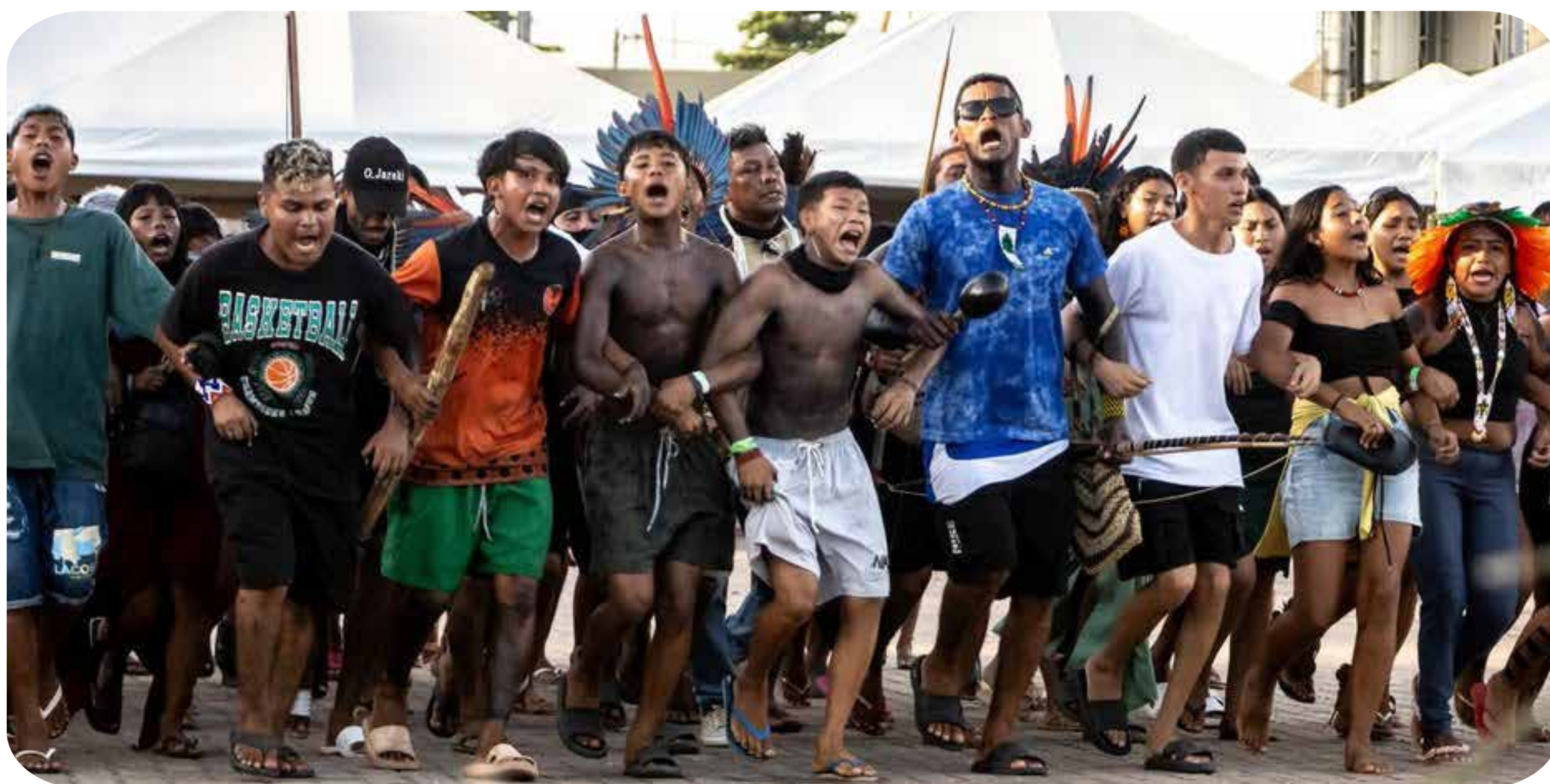
Indígenas comemoram a revogação do decreto 16.600

quando a luta é coletiva, com independência de classe e confiança na própria força, abre-se um caminho real de enfrentamento.