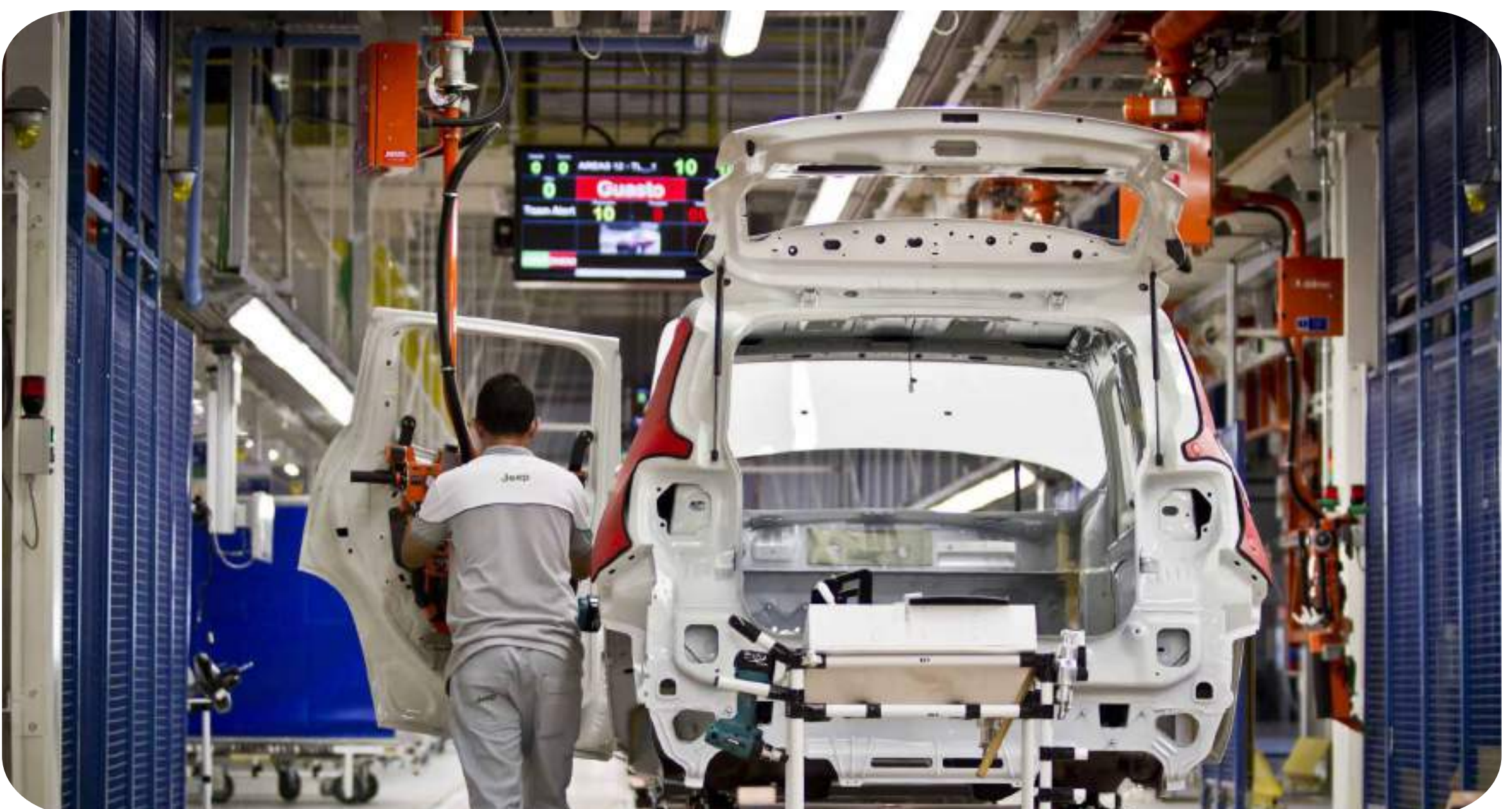
Fábrica Stellantis.

Os países que ocupam posições dominantes, sejam os Estados Unidos, a Suíça, a Suécia ou a Noruega, controlam, cada qual a seu modo, setores-chave da produção mundial. Dominam tecnologia, marcas, patentes, processos produtivos. Não vivem da exportação de produtos primários, mas da apropriação sistemática de valor gerado em escala global.