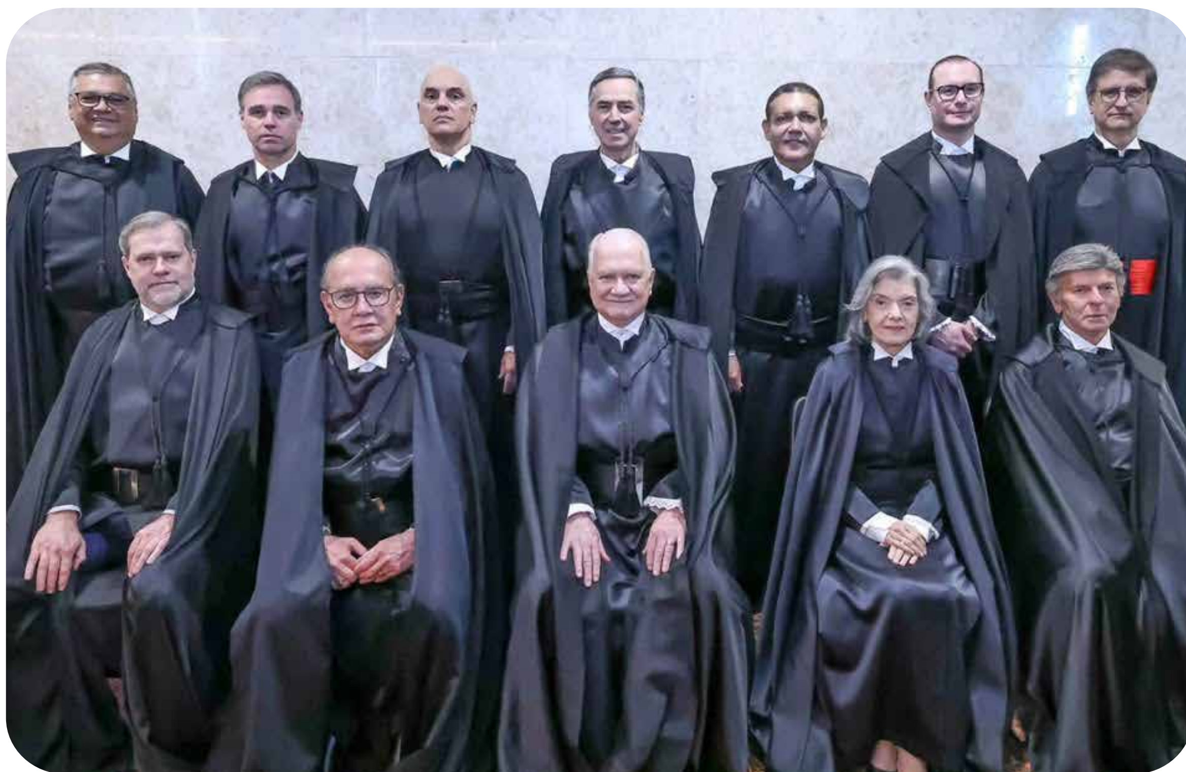
Membros do Supremo Tribunal Federal.

Enquanto fechávamos esta edição, o escândalo do Banco Master escalonava no aprofundamento de uma crise política que arrasta os três poderes, comprometendo de forma generalizada gente do governo, do centrão e da extrema direita.