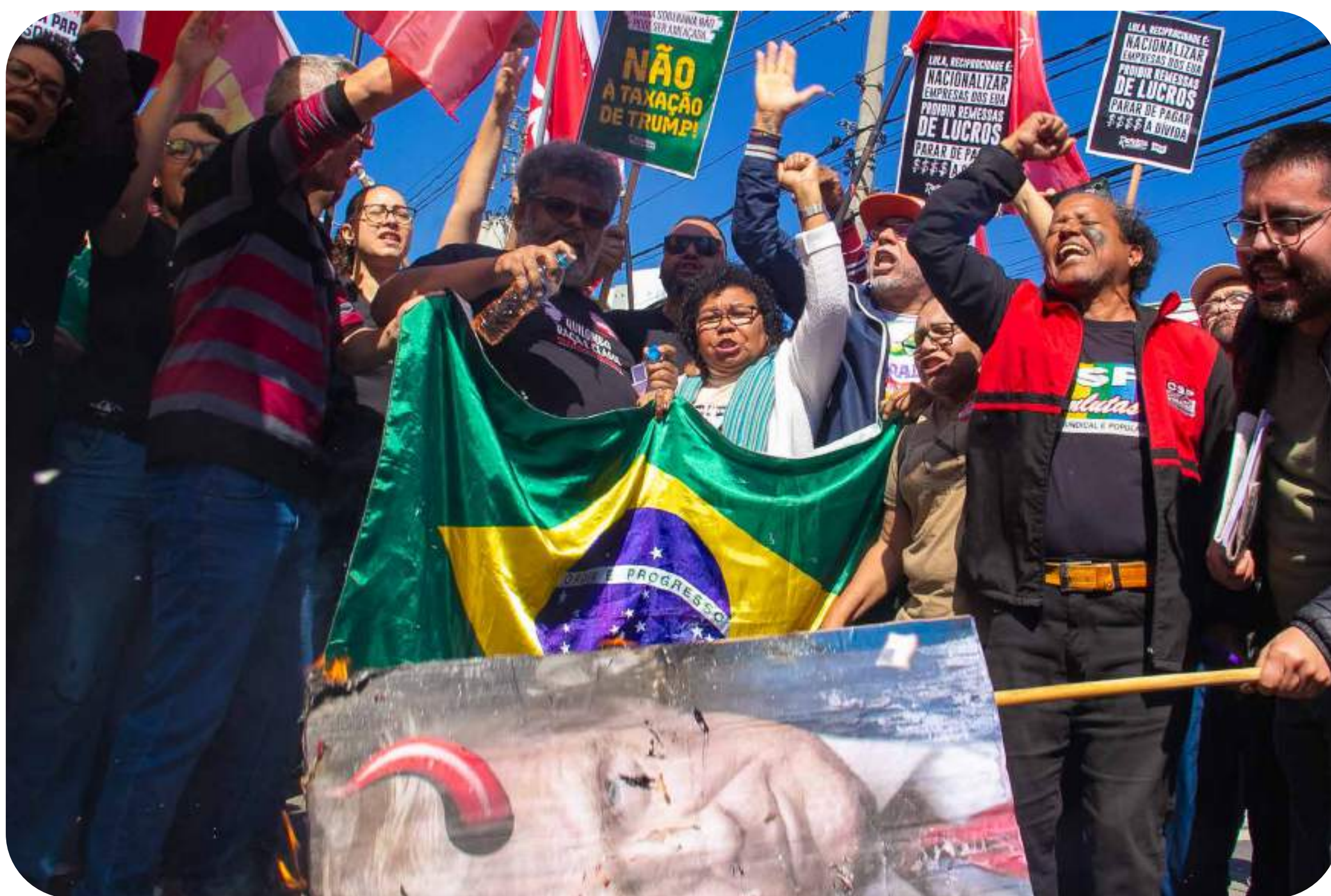
Manifestação em frente ao Consulado estadunidense contra o tarifação de Trump.

A renda desses setores deve ser direcionada a um planejamento econômico que permita ao país dar um salto e implementar as medidas que atendem aos interesses dos trabalhadores, o que hoje dizem ser impossíveis.