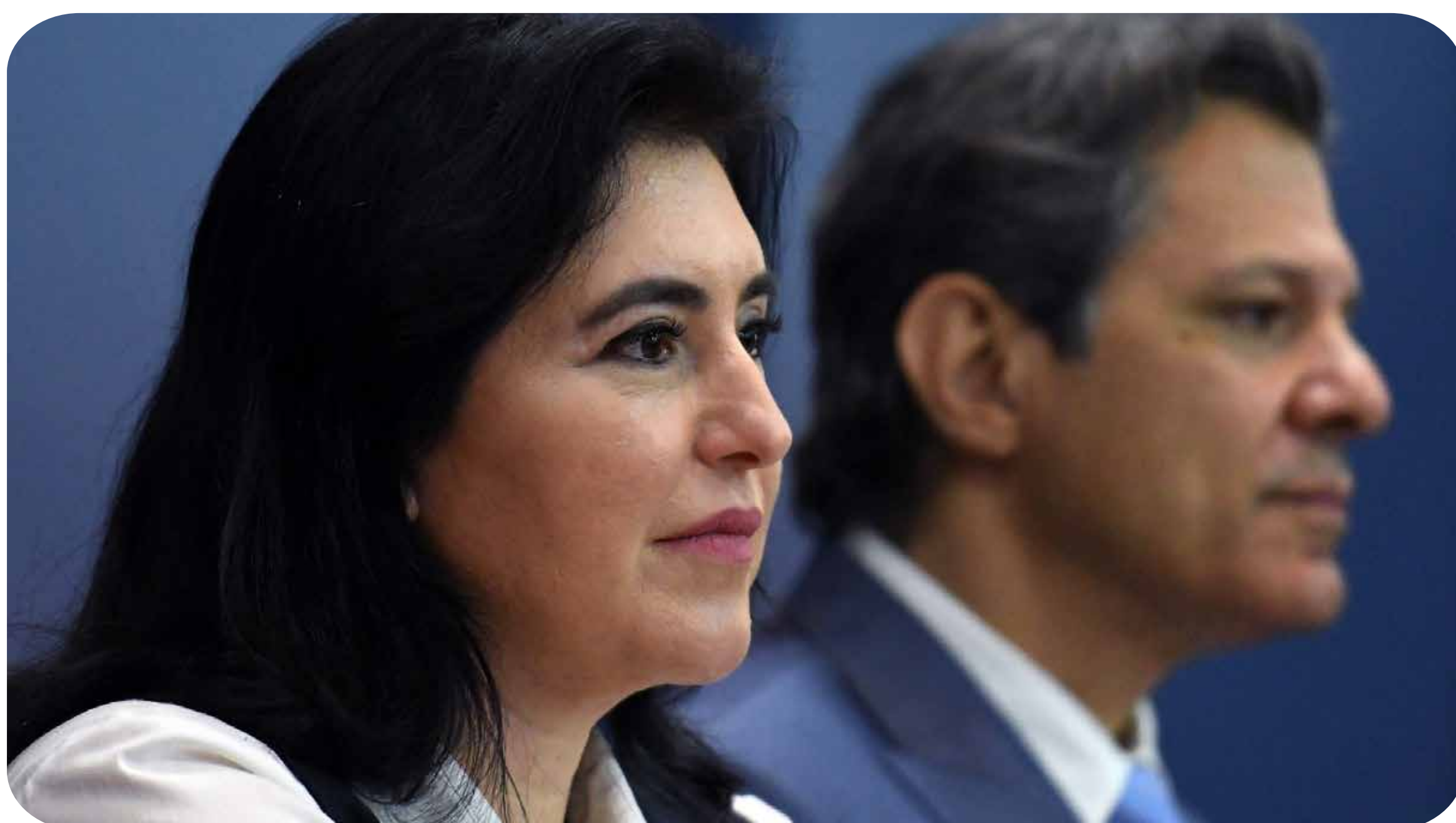
Ministra do Planejamento e Orçamento, Simone Tebet, e o ministro da Economia, Fernando Haddad.

Isso porque o problema é estrutural, de um país cada vez mais subordinado aos grandes monopólios capitalistas e ao imperialismo. Um sistema que o governo Lula não se propõe a enfrentar, mas administrar. Se na campanha eleitoral lá atrás Lula falou em revogar a reforma trabalhista, agora seu governo nem ao menos se dispõe a tocar nos interesses das grandes plataformas como a Uber ou o iFood, mantendo um regime de superexploração sem nenhum direito.