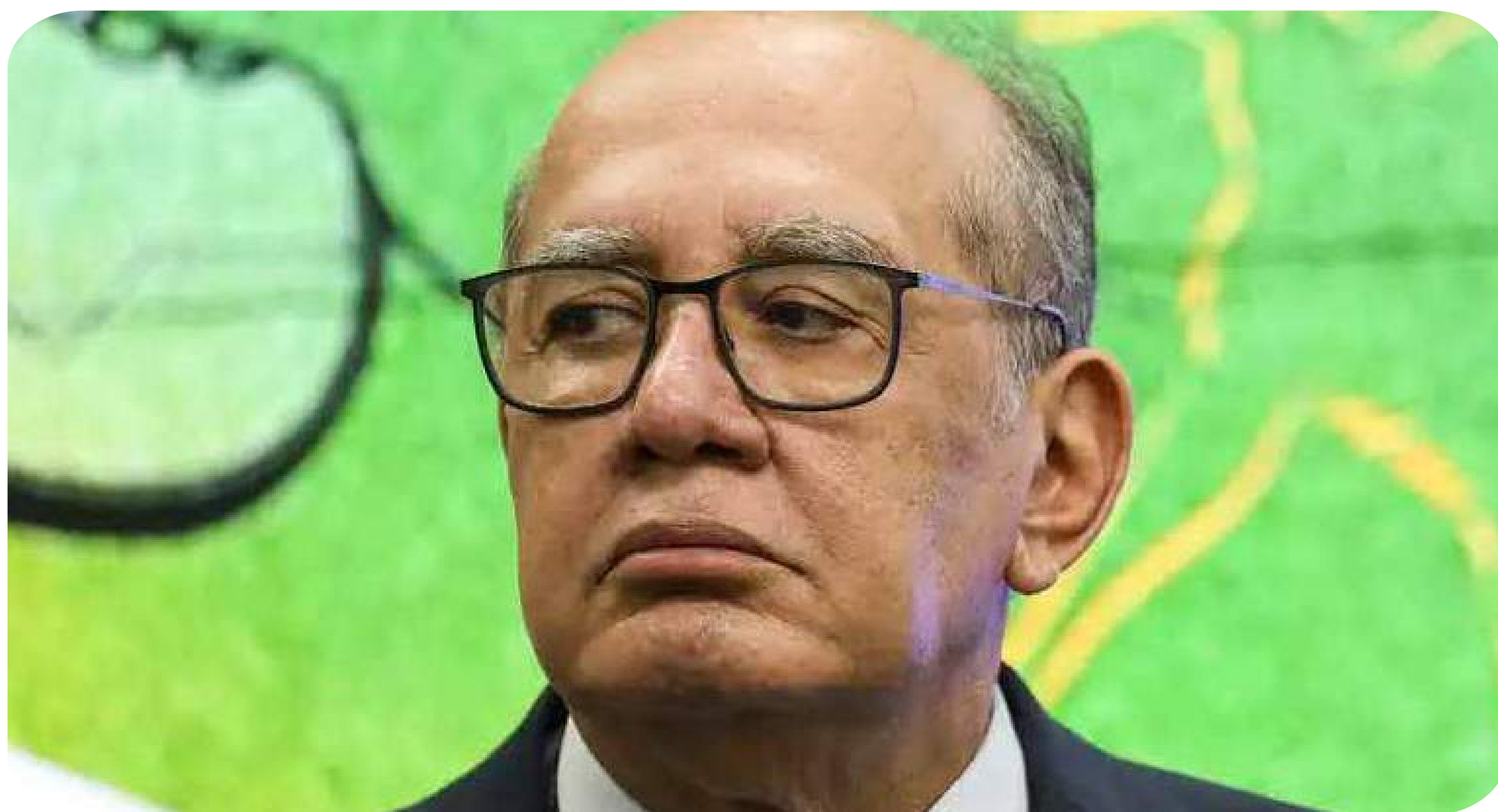
Ministro do Supremo Tribunal Federal do Brasil Gilmar Mendes.

Mas, mais que isso, essa crise serve para mostrar à classe trabalhadora que não se pode depositar um fio de esperança nas instituições do regime dos ricos. Os trabalhadores, os povos originários, as LGBTI+, as mulheres, as negras e negros, a população quilombola, a juventude e todos os setores explorados e oprimidos só podem confiar na força de sua própria mobilização para conquistar suas reivindicações, como a demarcação das terras indígenas, o fim da escala 6x1 e da pejotização, assim como os direitos dos trabalhadores por aplicativos. ■