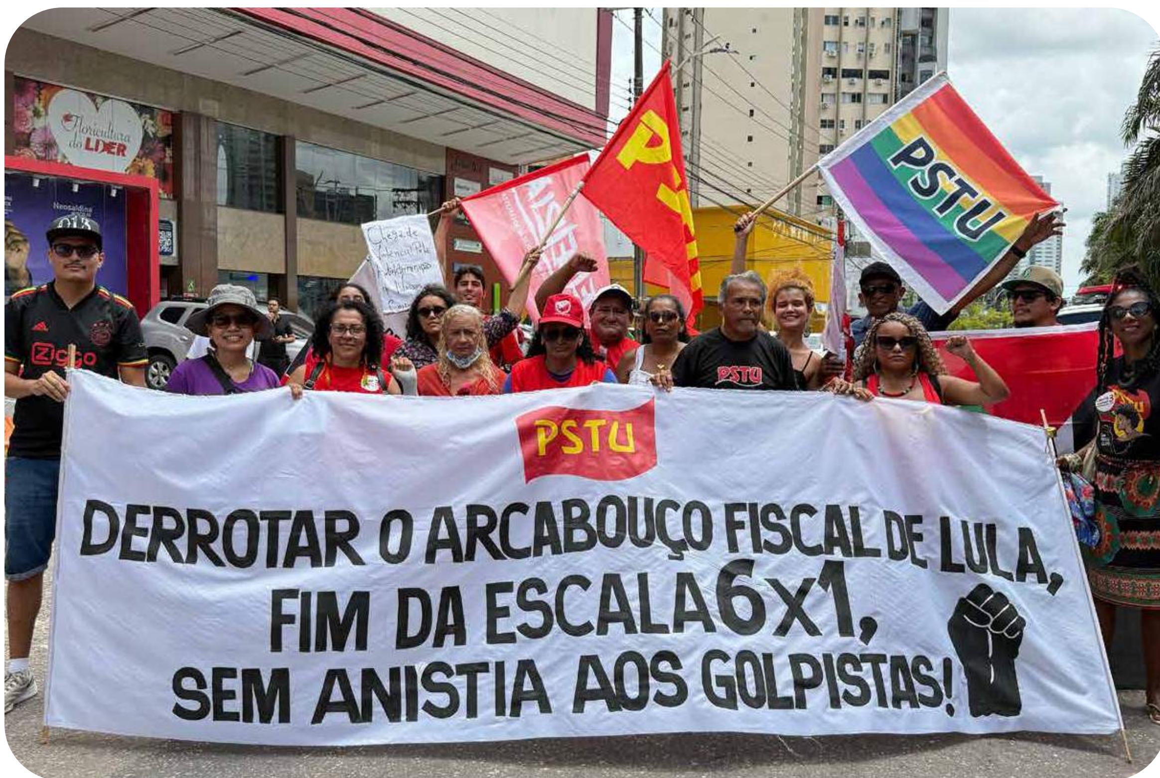
Manifestação em Belém (PA).

Estamos assistindo a guerras, uso de tarifas como arma para submeter países, ameaças autoritárias, chantagens diplomáticas e militares para garantir os interesses dos monopólios capitalistas. Trump expõe a face mais explícita da engrenagem da dominação imperialista e do autoritarismo da extrema direita. Quer tomar recursos naturais, dominar mercados, controlar tecnologias e subordinar países inteiros, sugando as riquezas produzidas pelos trabalhadores com suas multinacionais, que controlam economias nacionais inteiras. Subverte a ordem mundial para tentar reformatá-la para atender seus interesses nos marcos da disputa com o novo imperialismo capitalista ascendente da China.