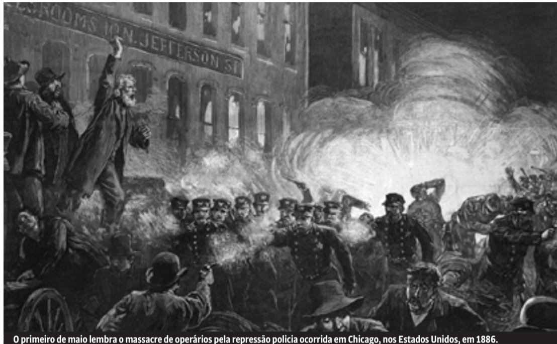
O primeiro de maio lembra o massacre de operários pela repressão policial ocorrida em Chicago, nos Estados Unidos, em 1886.

Na segunda metade do século 19, o desenvolvimento do capitalismo nos grandes centros europeus e nos Esta-