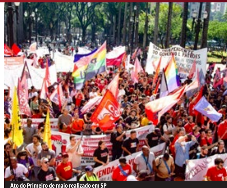
Ato do Primeiro de maio realizado em SP

Nos atos de “1º de Maio”, vamos defender que um polo independente e classista apresente um plano político e econômico que rompa com as ideias