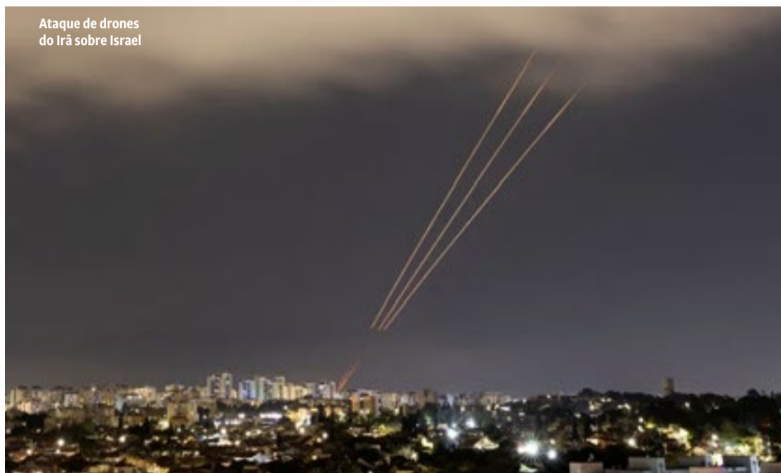
Ataque de drones do Irã sobre Israel

A população palestina, por sua vez, em um primeiro momento, vibrou com o contra-ataque iraniano; mas, depois, ficou decep-