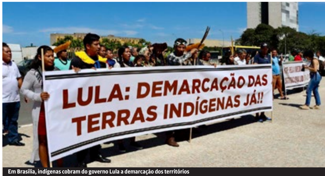
Em Brasília, indígenas cobram do governo Lula a demarcação dos territórios