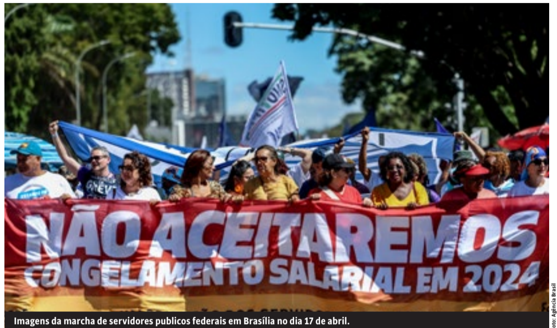
Imagens da marcha de servidores públicos federais em Brasília no dia 17 de abril.

Mas, a partir de 2016, com o impeachment de Dilma, seguido por dois anos de governo Temer (MDB) e os quatro anos de Bolsonaro, o PT e a CUT, contando com a capitulação de setores que surgiram no processo de 2004 (o PSOL, especialmente) foram aos poucos recompondo sua influência dentre os servidores federais. Embora uma parte do funcio-