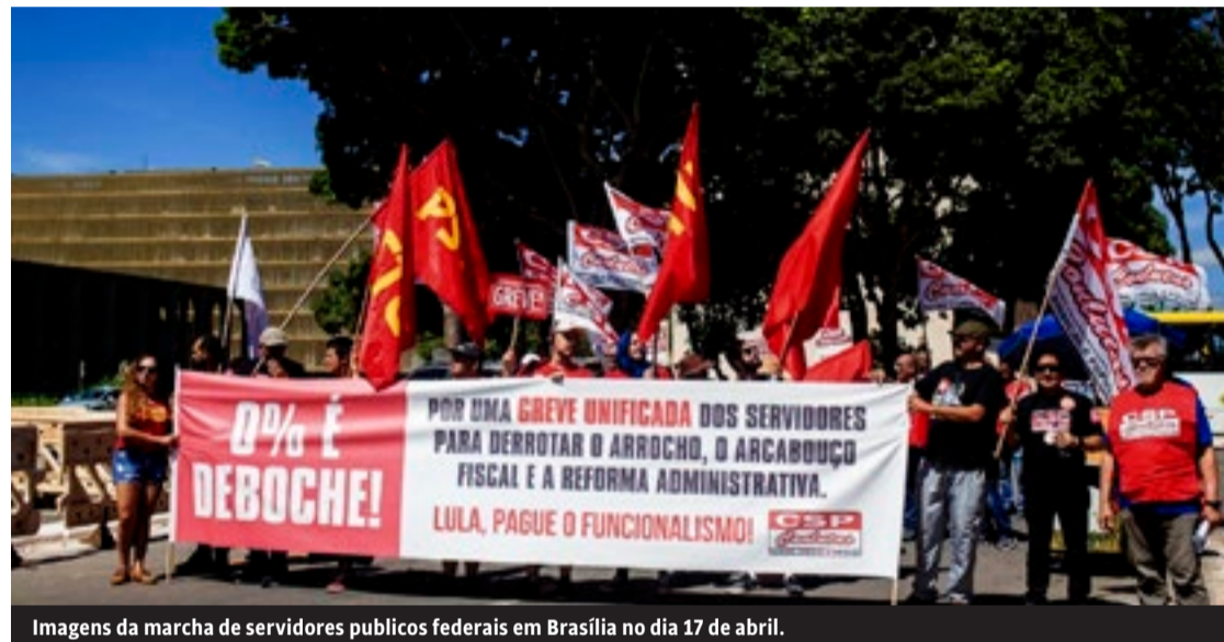
Imagens da marcha de servidores públicos federais em Brasília no dia 17 de abril.

Esses ataques não são uma expressão da “correlação de for-