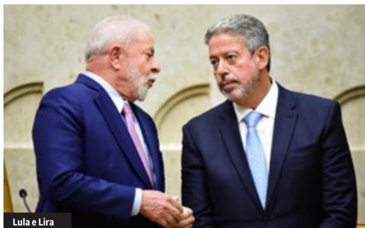
Lula e Lira

O NEM, aprovado ainda no governo Temer, começou a ser implementado durante o governo Bolsonaro. Rapidamente, gerou insatisfação na juventude e nos profissionais de Educação, que fizeram mobilizações pelo país e ganharam