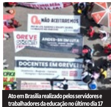
Ato em Brasília realizado pelos servidores e trabalhadores da educação no último dia 17

Por isso, também, consideramos importante a construção do “5º Encontro Nacional de Educação”, para que possamos reunir a vanguarda e discutir os rumos da Educação no país. E, no mesmo sentido, acreditamos que seja fundamental a presença de entidades como o Andes-SN, a Fasubra,