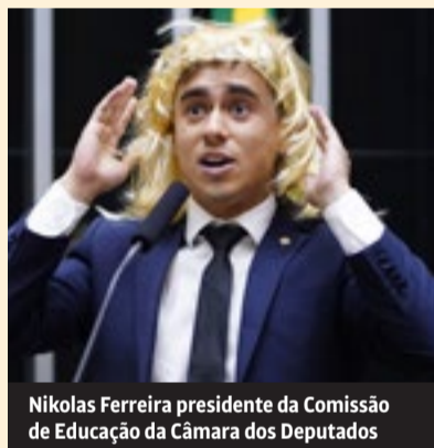
Nikolas Ferreira presidente da Comissão de Educação da Câmara dos Deputados

A aprovação do projeto de Novo Ensino Médio, através de um acordo entre o governo Lula e o Congresso, fortalece a privatização da Educação. Em São Paulo, o governador bolsonarista de ultradireita, Tarcísio de Freitas (Republicanos) anunciou que vai realizar um leilão para entregar dezenas de escolas públicas para a gestão da iniciativa privada. Tarcísio, que já privatizou a Sabesp (empresa de água e esgoto), pretende avançar em sua sanha privatista.