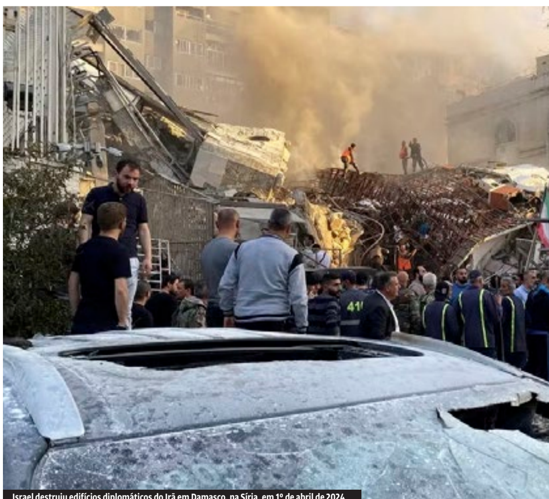
Israel destruiu edifícios diplomáticos do Irã em Damasco, na Síria, em 1º de abril de 2024

O regime iraniano se beneficiou da fraqueza do Estado sionista para fazer seu primeiro ataque direto a Israel em toda a História. Isso lhe deu prestígio em relação aos regimes árabes que, por temerem retaliações israelenses, evitam qualquer tipo de ação contra os sionistas.