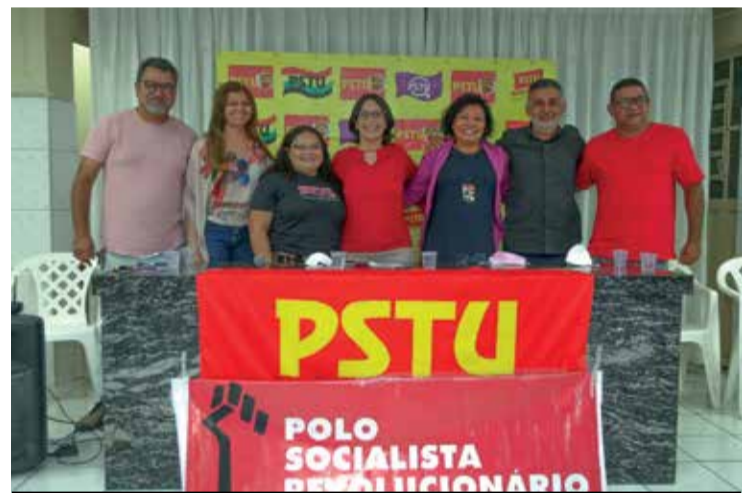
Lançamento de candidaturas no Piauí.