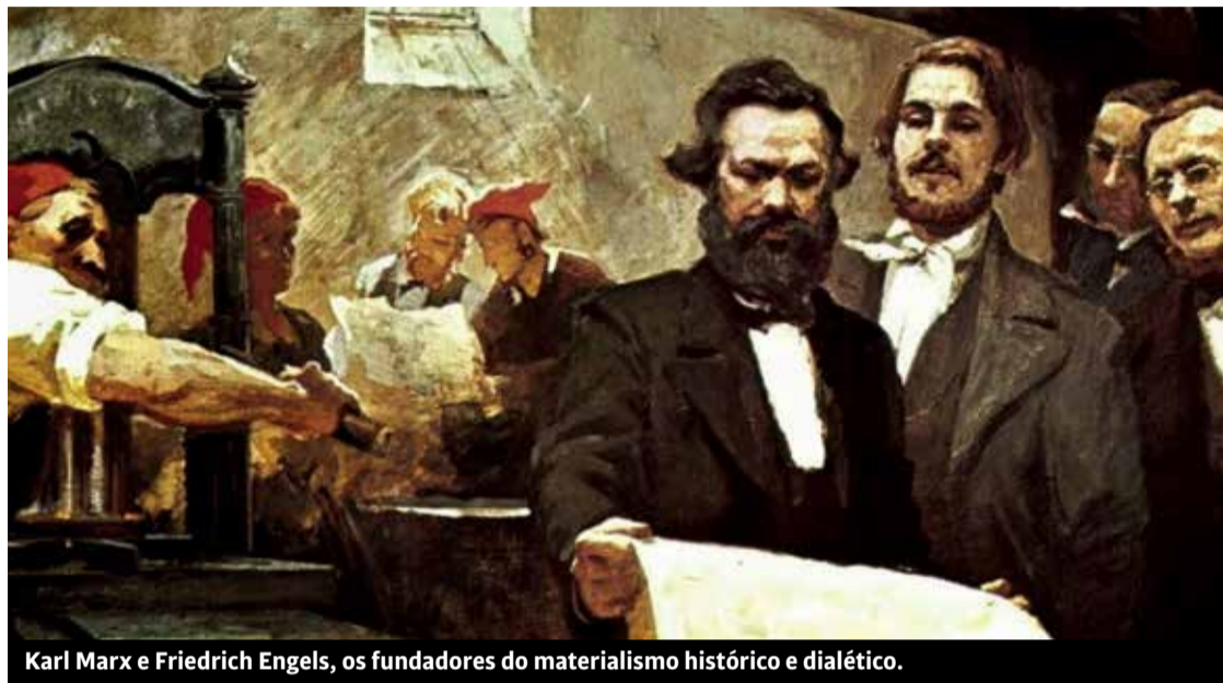
Karl Marx e Friedrich Engels, os fundadores do materialismo histórico e dialético.

Nesse sentido, o keynesianismo não é o oposto do liberalismo. O conservadorismo não é o oposto do pós-modernismo. Essas concepções são diferentes. Não há dúvidas sobre isso. Podemos até considerar um ou outro elemento isolado como sendo pior ou melhor do que o do outro. No conjunto, contudo, todas estão a serviço da mesma finalidade: a perpetua-