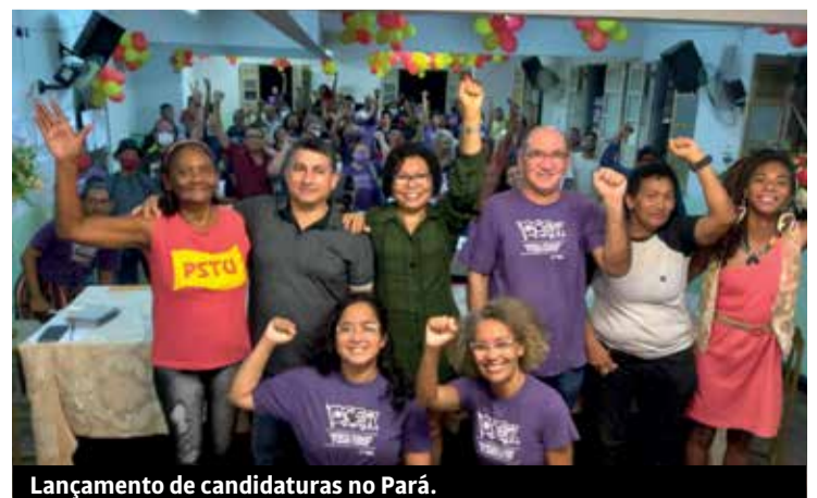
Lançamento de candidaturas no Pará.