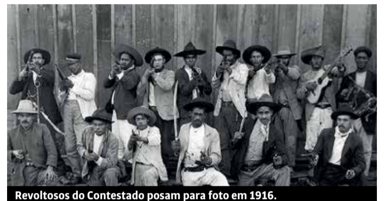
Revoltosos do Contestado posam para foto em 1916.

burguesia traíra levará à derrota da luta e mesmo a morte dos próprios conciliadores. Essa é a lição que ficou com o episódio de Ganga Zumba, líder do Quilombo dos Palmares, que preferiu se aliar com o Império português e abandonou a resistência: pouco tempo depois, a aristocracia burguesa rom-