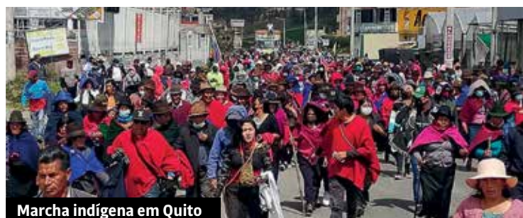
Marcha indígena em Quito

A heróica luta do povo equatoriano é um exemplo para todos os lutadores latino-americanos. Mas não basta dizer: não. É preciso dizer o quê queremos. Os 10 pontos que a CONAIE levanta não tem nenhuma consigna contra a o governo do grande capital, não tem