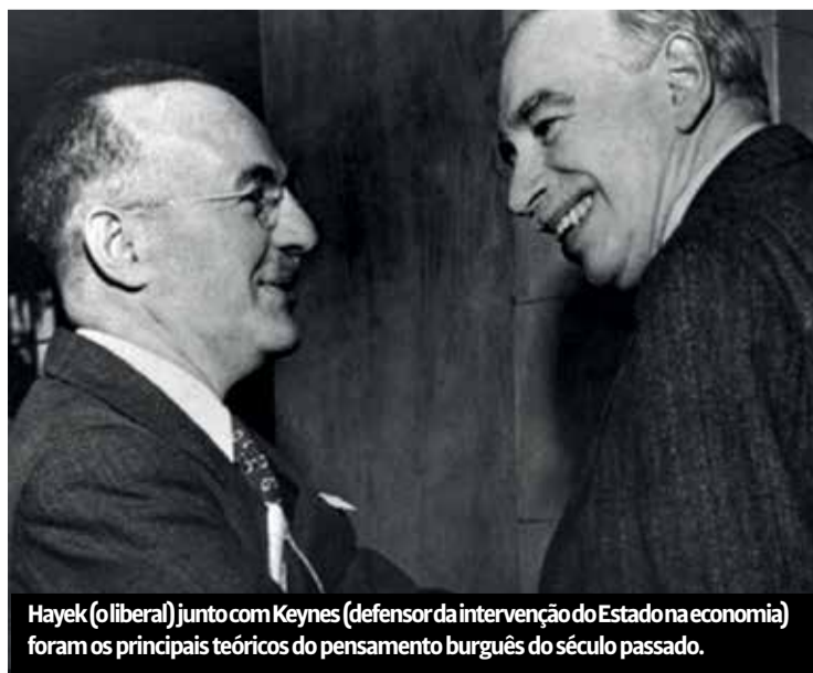
Hayek (oliberal) junto com Keynes (defensor da intervenção do Estado na economia) foram os principais teóricos do pensamento burguês do século passado.

O que procuramos mostrar em todos os artigos anteriores é que as ideologias burguesas não pairam nas nuvens. Todas elas têm uma base material. É o próprio capitalismo que produz, objetivamente, a possibilidade das ilusões que as ideologias burguesas – incluindo as reformistas – produzem.