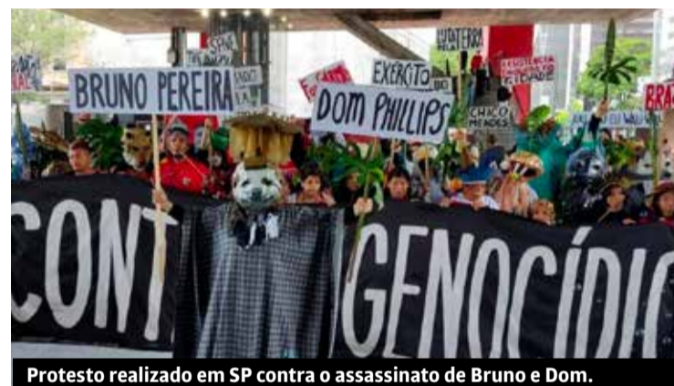
Protesto realizado em SP contra o assassinato de Bruno e Dom.

Há muitos outros casos de aumento de violência na Amazônia. Só o garimpo ilegal provocou nove mortes em 2020 e 109 em 2021, o que significa um aumento de 1.110%. Das 109 mortes em 2021, 101 eram de indígenas Yanomamis de Roraima. A explosão da garimpagem na Terra Indígena Yanomami também tem o dedo do crime organizado. Segundo indígenas e investigações da PF, os garimpeiros são dirigidos pelo PCC e