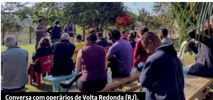
Conversa com operários de Volta Redonda (RJ).