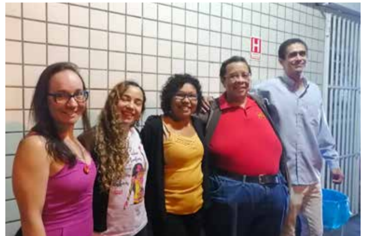
Lançamento de candidatura no Distrito Federal.