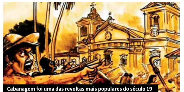
Cabanagem foi uma das revoltas mais populares do século 19

Também pode se ver que a conciliação de classe com a