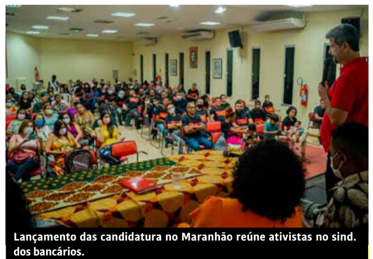
Lançamento das candidaturas no Maranhão reúne ativistas no sindicato dos bancários.