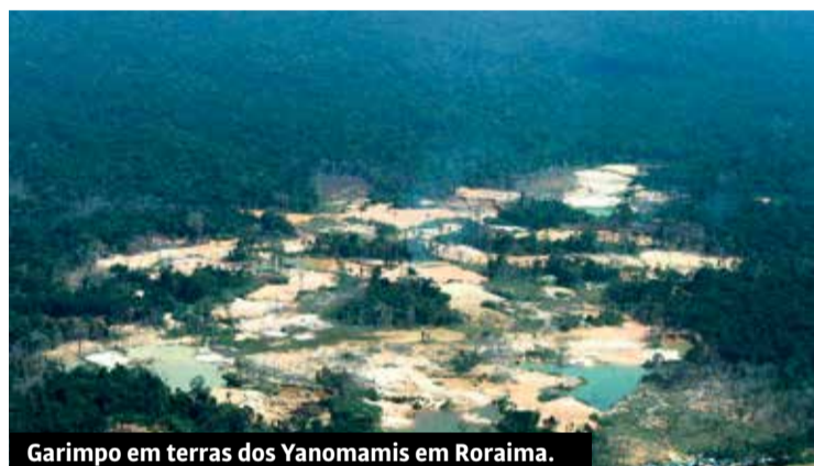
Garimpo em terras dos Yanomamis em Roraima.

Não por acaso que entre 2020 e 2021 o número de conflitos no campo explodiu, sendo o maior em 35 anos. Apenas o número de assassinatos cresceu