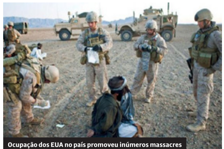
Ocupação dos EUA no país promoveu inúmeros massacres