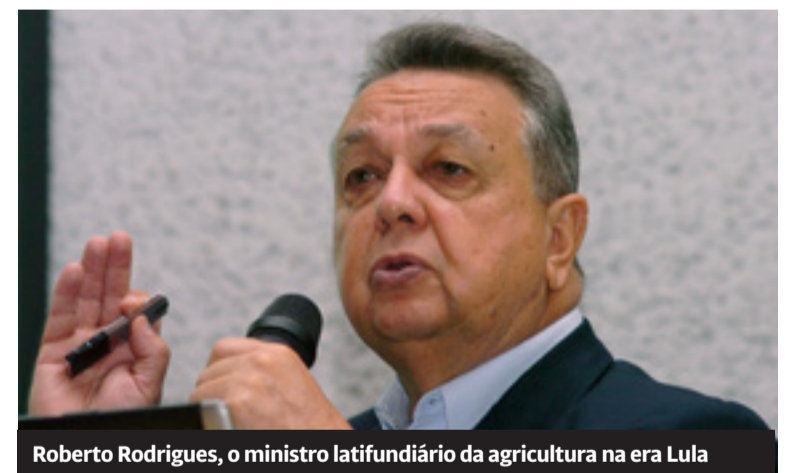
Roberto Rodrigues, o ministro latifundiário da agricultura na era Lula

Em relação ao campo, o balanço é impressionante. Não para a reforma agrária, como esperavam os ativistas. Como falou o insuspeito João Pedro Stedile, em 2012: “Nos últimos dez anos, não houve avanços em termos de reforma agrária. Nos últimos dez anos, se ampliou a concentração da propriedade