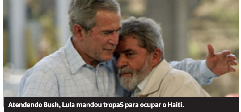
Atendendo Bush, Lula mandou tropas para ocupar o Haiti.

O PT aplicou toda a receita neoliberal em um momento de crescimento econômico. Garantiram a estabilidade e altos lucros para a burguesia, por 14 anos, com pequenas concessões para os trabalhadores.