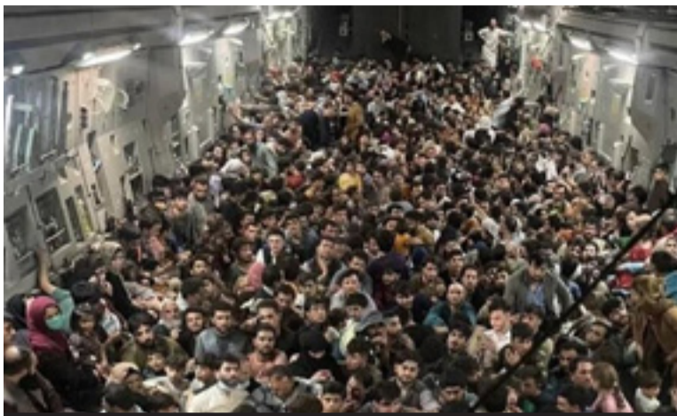
Afegãos em fuga após a tomada do poder pelo Taliban dentro de um avião dos EUA

ger Cabul, as instituições do regime fantoche e os bairros mais centrais. Por outro, para realizar operações de “assassinato seletivo” contra líderes talibans. O objetivo estratégico era a retirada.