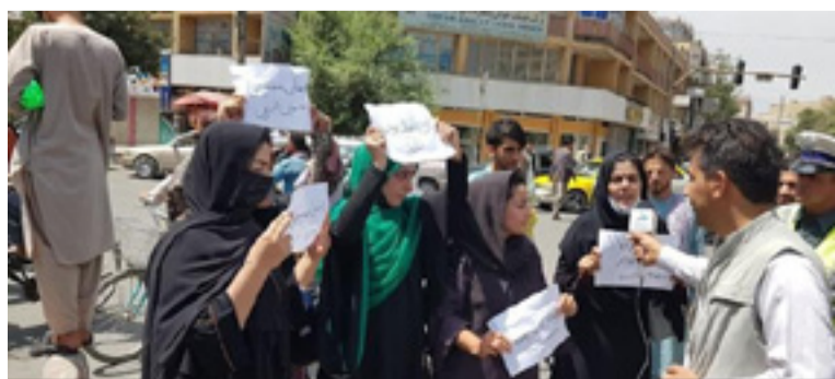
No Afeganistão, mulheres protestam pela manutenção dos seus direitos após a tomada do governo pelo Talibã

A consumação de uma derrota imperialista fortalece as lutas dos trabalhadores e das massas no mundo contra o imperialismo. Ao mesmo tempo, uma organização cujo projeto é instalar uma ditadura teocrática assumiu o poder. Por isso, a tarefa que começa, agora, no Afeganistão é a luta contra o novo governo.