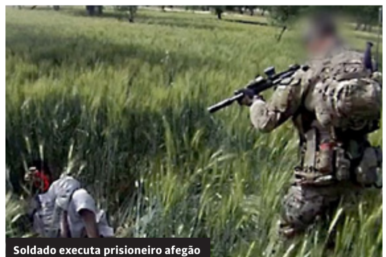
Soldado executa prisioneiro afegão

Obama já havia começado uma inversão da marcha: a retirada gradual das tropas estadunidenses até deixar um máximo de 10 mil soldados; essencialmente, por um lado, para prote-