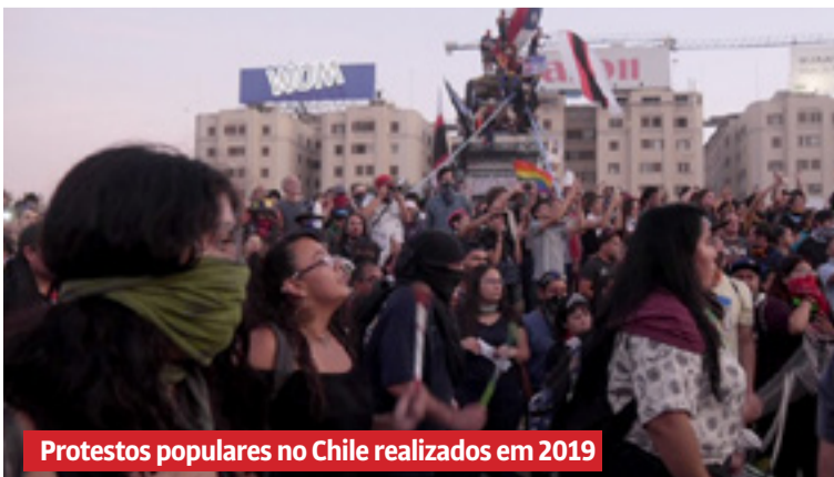
Protestos populares no Chile realizados em 2019