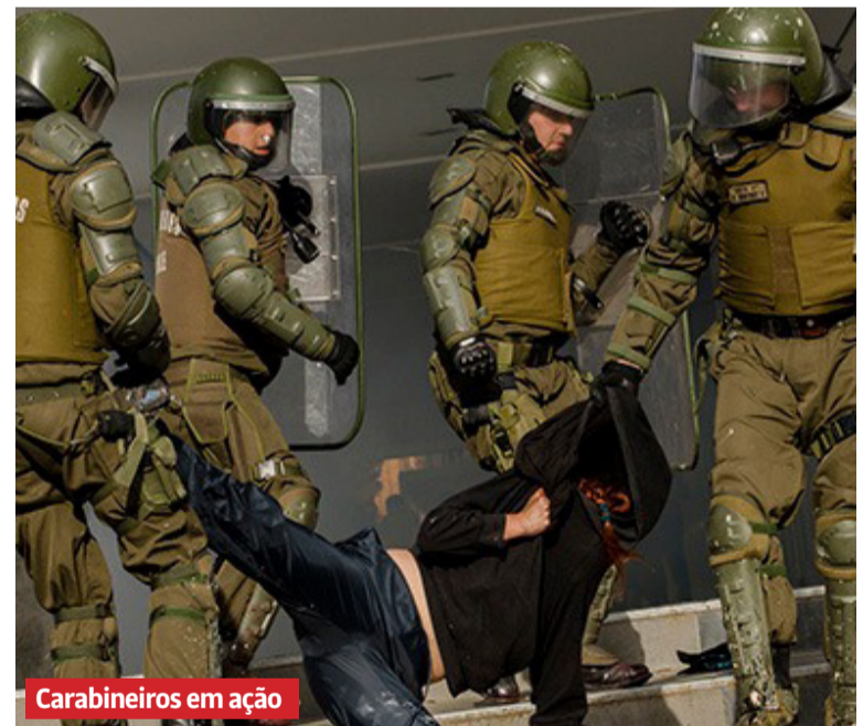
Carabineiros em ação

Sua candidatura defende que a maioria da riqueza produzida no país esteja a serviço de solucionar os problemas de saúde, educação, aposentadorias, moradia, que afetam a enorme maioria da população. Também defende o fim das atuais Forças Armadas e dos carabineiros e sua substituição pelo povo armado. Hoje, as Forças