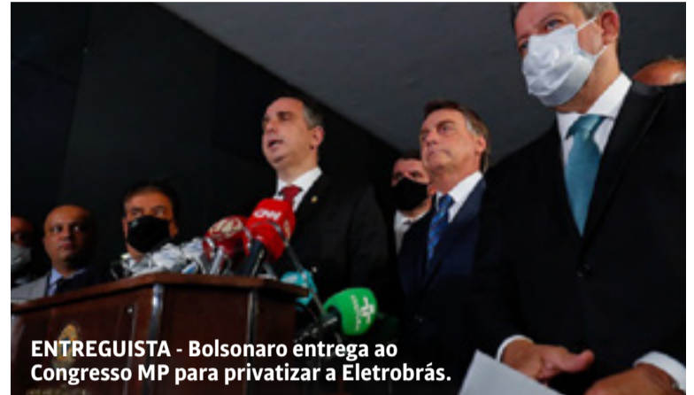
ENTREGUISTA - Bolsonaro entrega ao Congresso MP para privatizar a Eletrobrás.

Essa pressão e especulação não quebrará a Petrobras, mas poderá colocar o mercado consumidor brasileiro refém do cartel internacional do petróleo.