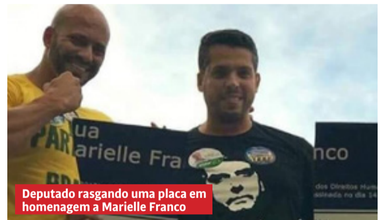
Deputado rasgando uma placa em homenagem a Marielle Franco