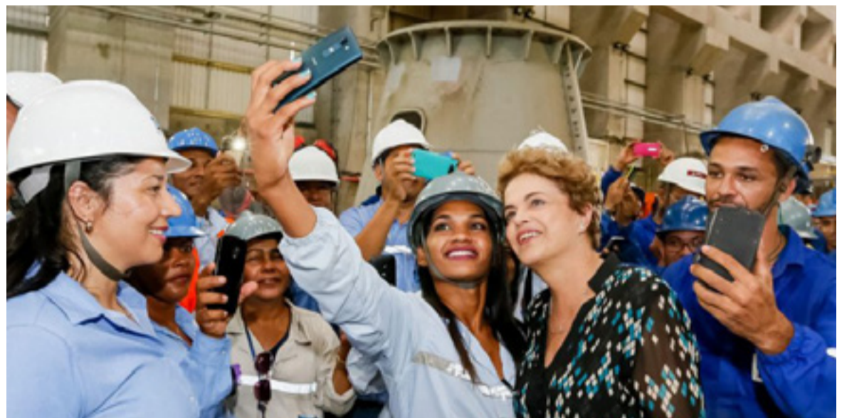
Dilma durante a inauguração de Belo Monte. Projetada na ditadura, a hidrelétrica foi construída pelos governos do PT passando por cima dos clamores dos indígenas e ribeirinhos afetados pela obra.

Quando as correntes progressistas se constituem em partidos que disputam o jogo político da sociedade capitalista e, ainda mais, quando ganham eleições e constituem governos ditos progressistas, sua atuação ganha outro aspecto. Para chegar ao governo e se manter nele nos mar-