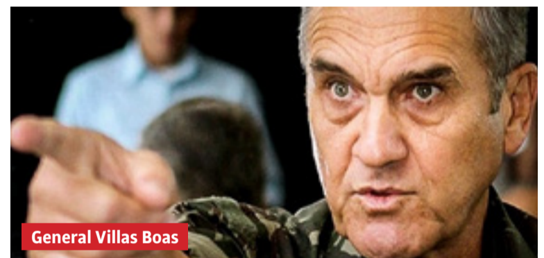
General Villas Boas

agora porque não teve apoio nem forças para tal.