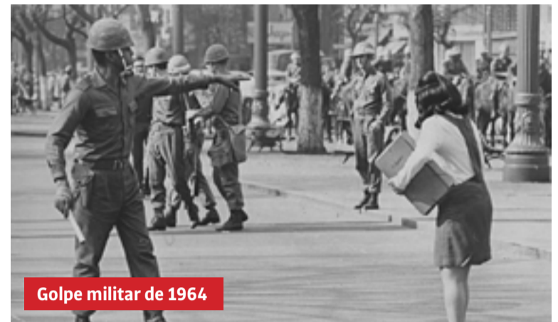
Golpe militar de 1964

Bolsonaro não é apenas um governante com uma política genocida frente à pandemia do novo coronavírus. Frente à catástrofe na economia, usa rios de dinheiro público para ajudar bancos e grandes empresários, deixando os pequenos à míngua, trabalhadores desempregados e sem direitos. Em pleno agravamento da pandemia, corta o auxílio emergencial dos mais necessitados. Privatiza o patrimônio do país, sucateia o serviço público, destrói o meio ambiente. Ele também é um governante que nunca deixou de defender a implantação de uma ditadura militar no país e nem sequer esconde esse objetivo. Só não levou adiante esse projeto até