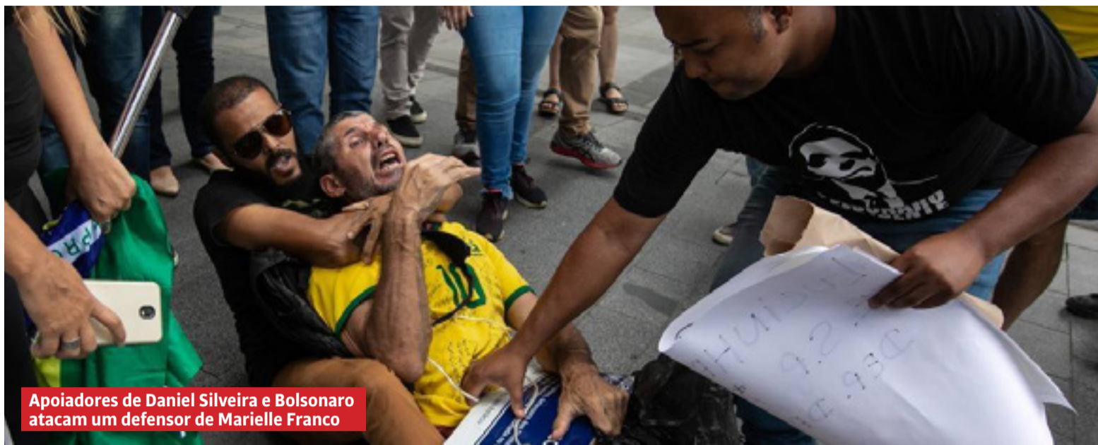
Apoiadores de Daniel Silveira e Bolsonaro atacam um defensor de Marielle Franco

mocrático burguês ou numa ditadura enquanto lutamos para superar esse sistema capitalista decadente. Até